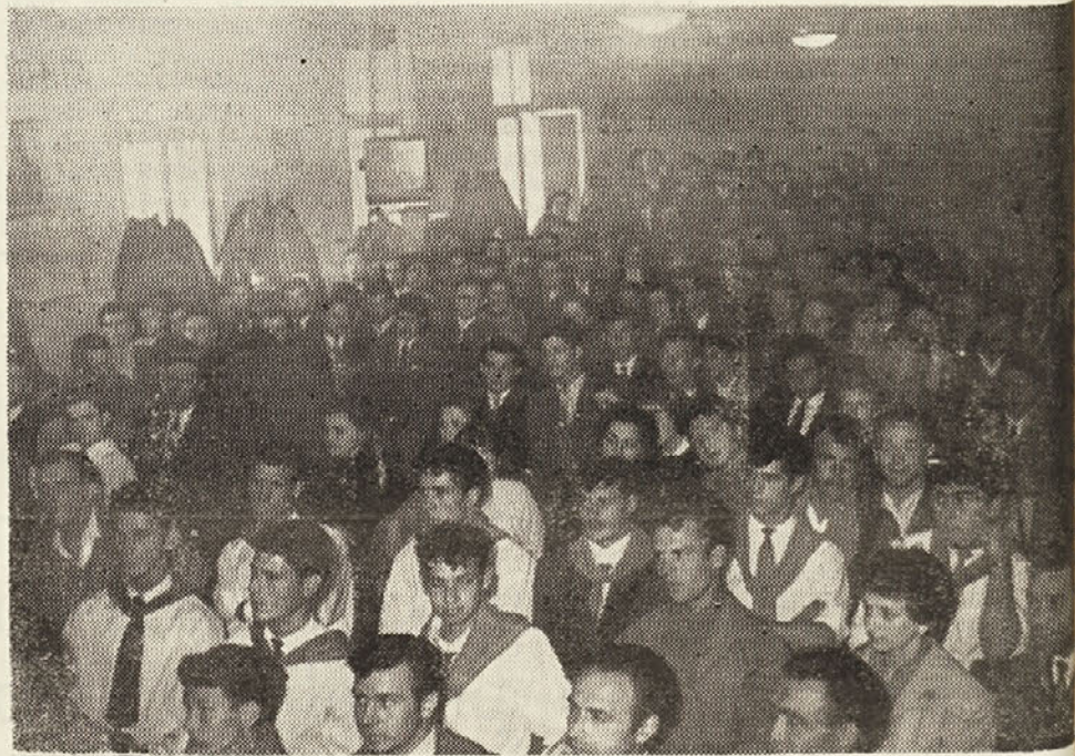
Pogled na del dvorane v teku zasedanja kongresa

V povezavi z akcijo za avtonomijo in gospodarsko obnovo se bo ZKM borila v obrambo pravic Slovencev na vseh področjih, za uveljavitev posameznega statuta priloženega Spomenici o sporazumu s strahobeh vlad, utrjujoč bratsko notnost med mladimi Slove-