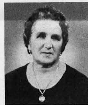
ob desetletnici smrti naše drage mame