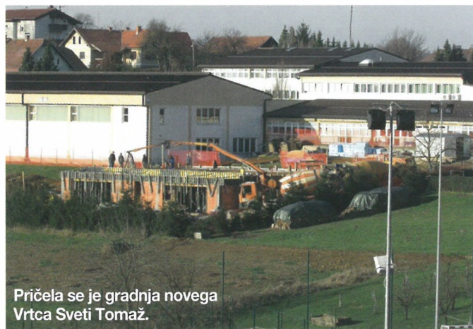
Pričela se je gradnja novega Vrtca Sveti Tomaž.

Poleg investicij smo v letu 2013 zagotavljali sredstva za delovanje Osnovne šole in Vrtca Sveti Tomaž. Za de-