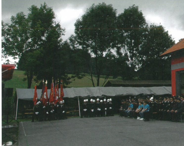
Otvoritev novega Gasilskega doma Koračice.

Začetki so bili težki, na eni strani negotovost glede fi-