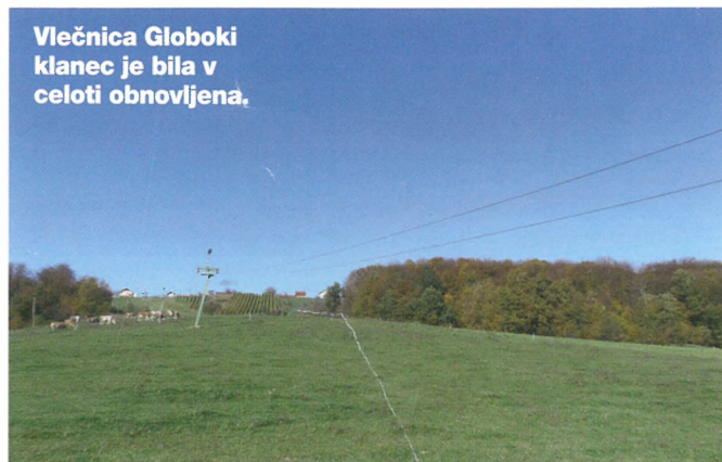
Vlečnica Globoki klanec je bila v celoti obnovljena.