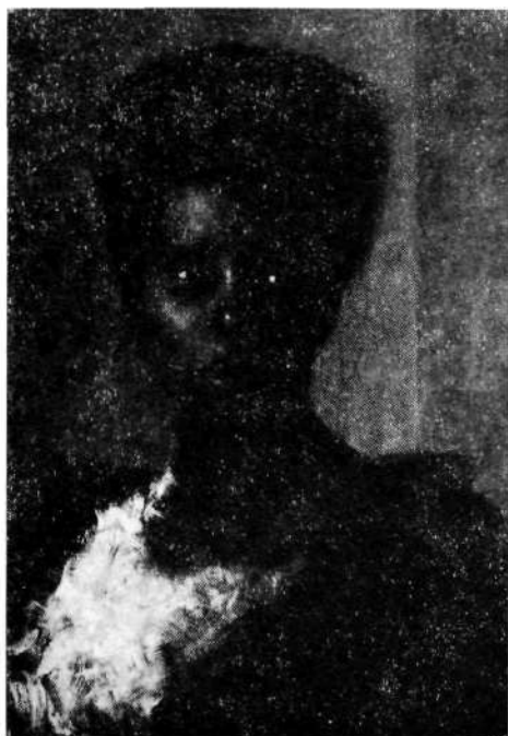
Anton Ažbe: Zamorka, 1895, Narodna galerija, Ljubljana

Ker se je zaradi revščine moral preživljati z likovnim poučevanjem in je njegova šola vsak dan trajala od 8—12 in od 14—19, je utegnil vedno manj slikati zase. Leta 1889, še pred zaključkom študija, je narisal Avtoportret in ga podaril bratu Lojzetu. Tega portreta se domačini iz Dolenčič še spominjajo