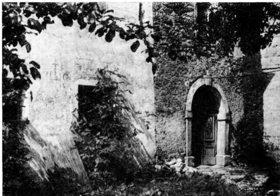
Vhod v kasneje prizidani, še neometani del rojstne hiše; stari del je levo, okrašen s slikarji; skrajno desno je stena nove hiše. Foto J. Dolenc, 1976

Spomladi 1891 pa je na pobudo slovenskih slušateljev akademije Jakopiča in Vesela ustanovil svojo slikarsko šolo. Ta šola je kmalu dosegla velik sloves in velik vpis, zato je Ažbe moral najeti obsežne prostore na Georgenstrasse 16,