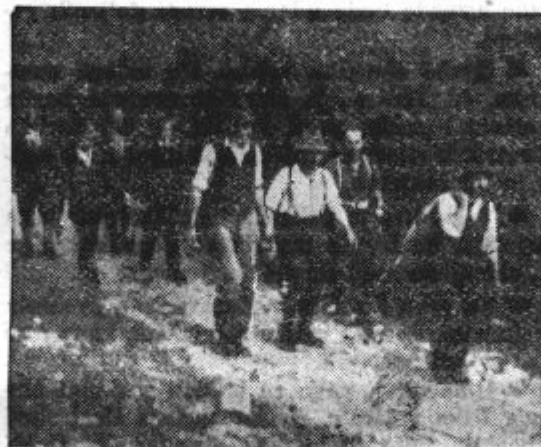
Romantika slovenskih polharjev na Dolenjskem še vedno živi, čeprav ni več tako donosna ko v Jurčičevih časih.

Zveza in včlanjena društva so priredila veliko število razstav, predavanj, tečajev, raznih prireditev, dalje so razdelila veliko število brezplačnih živali med svoje člane ter tako uspešno propagirala rejo malih živali med najširšimi plastmi naroda. Vse delo je bilo izvršeno iz zasebne pobude požrtvovalnih delavcev na polju rejskega pokreta. V zadnjem času je dosegla organizacija rejcev najlepši uspeh, da so se združili vsi slovenski rejci pod svojo Zvezo, ki vodi smoterno delo rejskega pokreta po vsej Sloveniji.