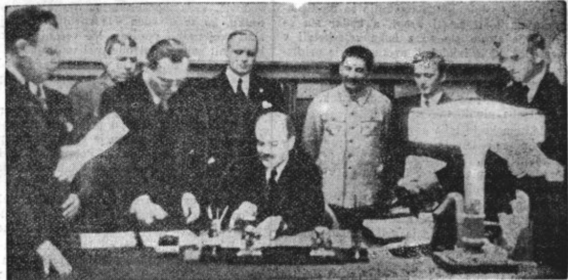
Zgoraj: Take se dobrote vojne v razdejani Poljski. — Spodaj: Molotov v navzočnosti Stalina, Ribbentropa in drugih predstavnikov obeh pogodbenic podpisuje rusko-nemški pakt.