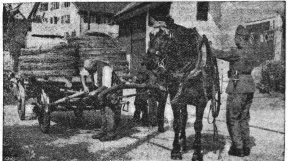
Prizori iz nesrečne Poljske: Obup poljskega kmeta v razdejanem domu (levo). — Kljub vojni in razdejanju je treba življenje in delo obnoviti (desno).