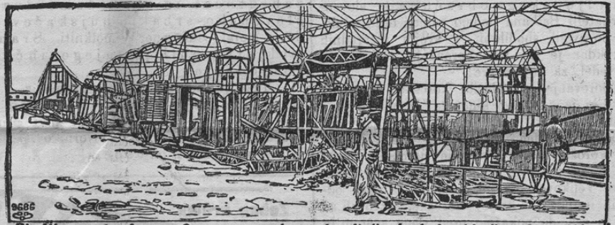
Die Überreste des am Comersee verbrannten italienisch. Lenkballons CittàdiMilano.

Dne 9. maja zadela je italijansko vojaško zrakoplovstvo velika nesreča. Letalni stroj „Città di Milano“ bil je vsled razstrelbe popolnoma uničen. Vihar je namreč blizu Cente odtrgal letalni stroj; okoli 150 m od lice mesta vstavil se je stroj v vejevju drevja, ki je balonu mnogo škodovalo. Plini so se vneli in zgodila se je eksplozija, vsled katere je bil takoj ves stroj v plamenih. 50 oseb, ki so prihiteli na pomoč,