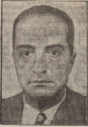
Giuseppe Bottai, guverner Rima, je bil imenovan za civilnega guvernerja abesinskega glavnega mesta Addis Abebe.