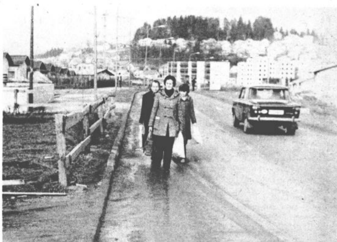
Do trgovine je daleč in tudi pločnik še ni končan

Med pogovorom pa naši sogovorniki niso govorili le o težavah, ampak so omenili tudi nekatere uspehe. Postavitev semaforjev v križišču ceste Veljka Vlahoviča in Šaleške ceste je bistveno zmanjšala ogroženost pešcev, zlasti pa otrok, ki so vsak dan s strahom prečkali Šaleško cesto. Druga pomembna pridobitev je bila izgradnja pločnika ob cesti Veljka Vlahoviča. Žal, pločnik še ni v celoti narejen zaradi določenih nesoglasij pri odkupu zemlje. Varnost v prometu se je delno izboljšala tudi z izgraditvijo peš poti od Gorice do središča mesta ob robu gozda. Ob tem pa morajo urediti še priključke na ceste I, II, III, IV in V, neurejena pa je tudi še cestna razsvetljava. Med pomembne pridobitve v krajevni skupnosti vsekakor sodi tudi nov otroški vrtec za 120 otrok, vendar pa to vprašanje s tem objektom še ni rešeno. Kljub novemu vrtcu Ciciban in posameznim odelkom v blokih niso mogli sprejeti vseh otrok, ki bi želeli obiskovati vzgojno varstveni zavod, zato že sedaj poudarjajo, da bo potrebno zgraditi še en vrtec.