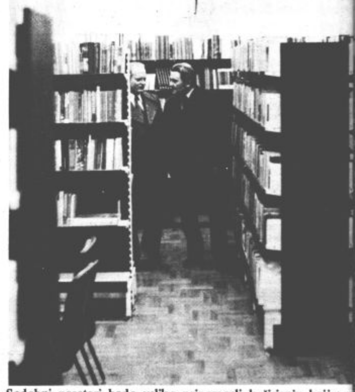
Sodobni prostori bodo veliko pripomogli k širjenju knjige med občani