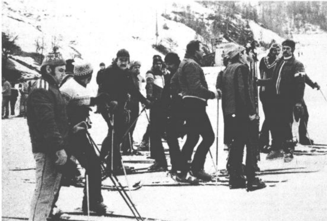
Nedeljskega prvenstva v veleslalomu se je kljub neugodnim vremenskim razmeram udeležilo nad 300 zaposlenih.