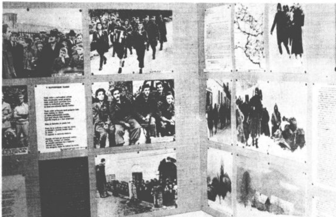
Del zbirke v Kajuhovi spominski sobi

„Za našo šolo je značilno, da imamo zelo veliko vozačev, kar povzroča vsem dobro znane težave, kot so motenje izvenšolskih dejavnosti, neenaka predšolska vzgoja, ki vpliva tudi na učne navade ter uspehe in še kaj. Vse te probleme skušamo