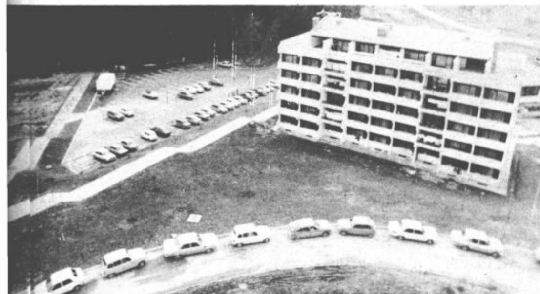
Parkirišče je polprazno. Okoli stanovanjskih blokov in na zelenicah pa je polno avtomobilov