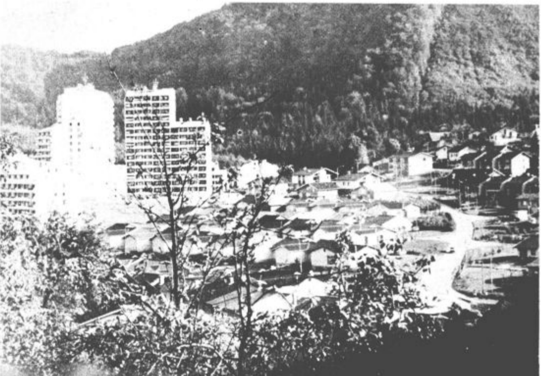
Naša krajevna skupnost iz drugega konca našega mesta