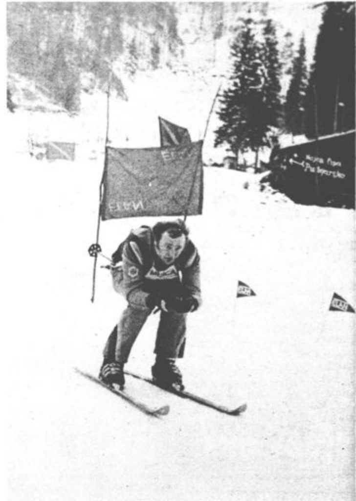
Kar spretno so vijugali med vratnicami

Tudi za letošnje leto so že sprejeli program športnih aktivnosti. Podobno kot lani bodo tekmovali v trinajstih panogah, nadalje organizirali razne trim akcije kot so pohod na Paški Kozjak, na Špik in Graško goro, plavanje, igre brez meja in kolesarjenje. Sodelovali bodo tudi v občinski rekreacijski hokej ligi, se udeležili (že to nedeljo) zimskih iger elektrogospodarstva Slovenije, zatem letnih iger elektrogospodarstva, rudarskih športnih iger ter pripravili vrsto tekmovalnih srečanj z delavci Tovarne gospodinjske opreme Gorenje Velenje