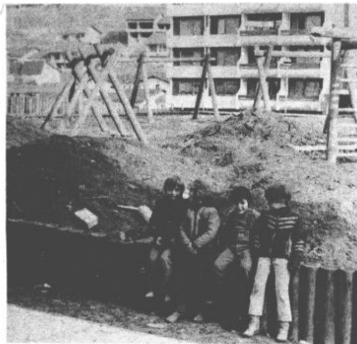
Igrišče je veliko, a še neurejeno in blatno

kiosk za časopise, prostor za družabno življenje in podobno. Ne zadovoljni smo tudi z avtobusi, ki res vozijo vsake pol ure, vendar je premalo postajališč. Sicer pa upamo, da se bodo tudi te stvari vendarle le enkrat uredile.“