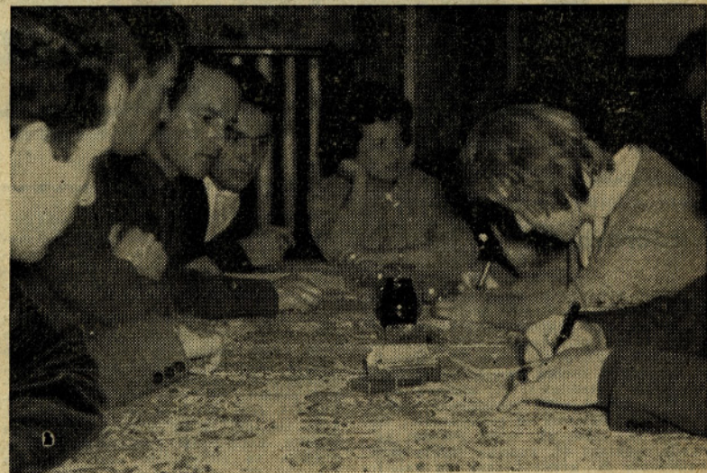
DVAKRAT MED ŠTIPENDISTI

Že v novembru so se predstavniki našega podjetja udeležili sestanka, ki so ga sklicali visokošolski štipendisti v Ljubljani. Takrat je bilo največ govora o razmeroma nizkih štipendijah. Predstavniki podjetja so obljubili, da bodo organi delavskega upravljanja v najkrajšem času razpravljali o tem vprašanju.