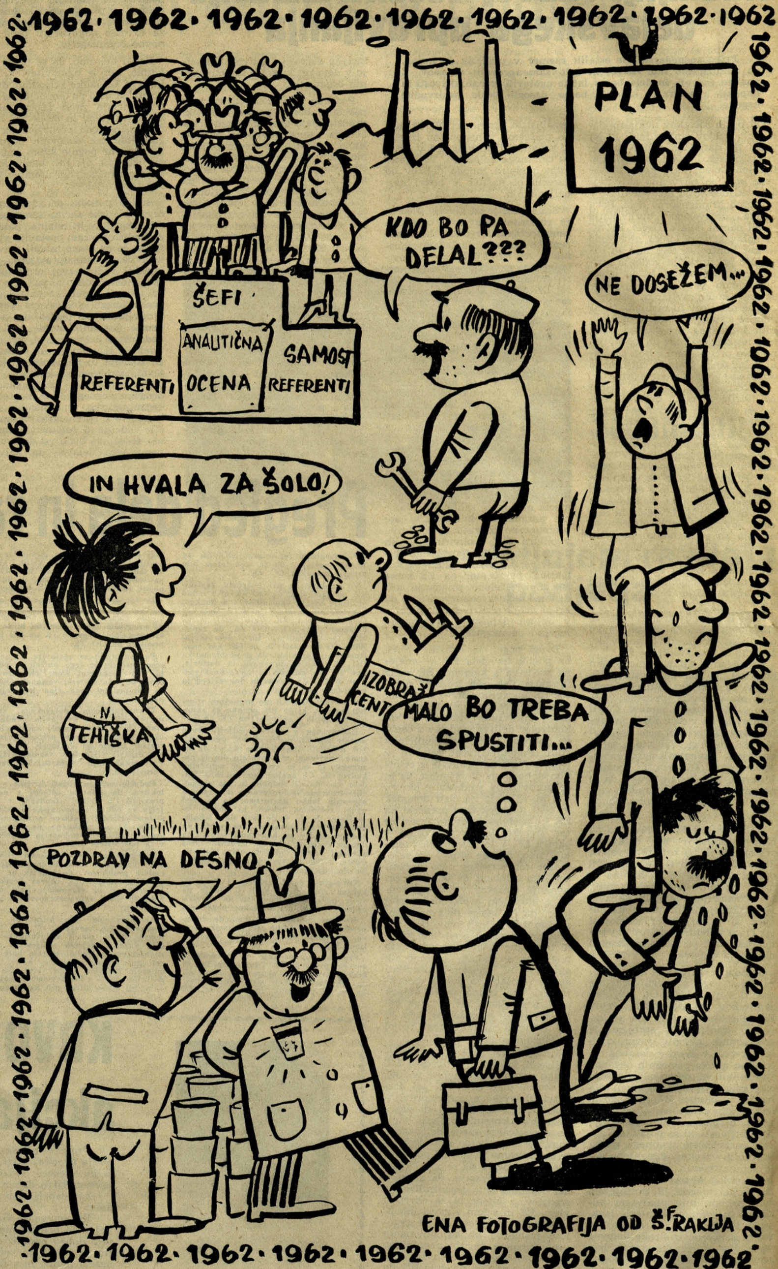
ENA FOTOGRAFIJA OD Š.F. RAKIJA

— Le kako bi se poznalo, saj je zima. Počakajmo na pomlad, ga je potolažil njegov sosed.