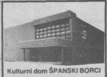
Kulturni dom ŠPANSKI BORCI