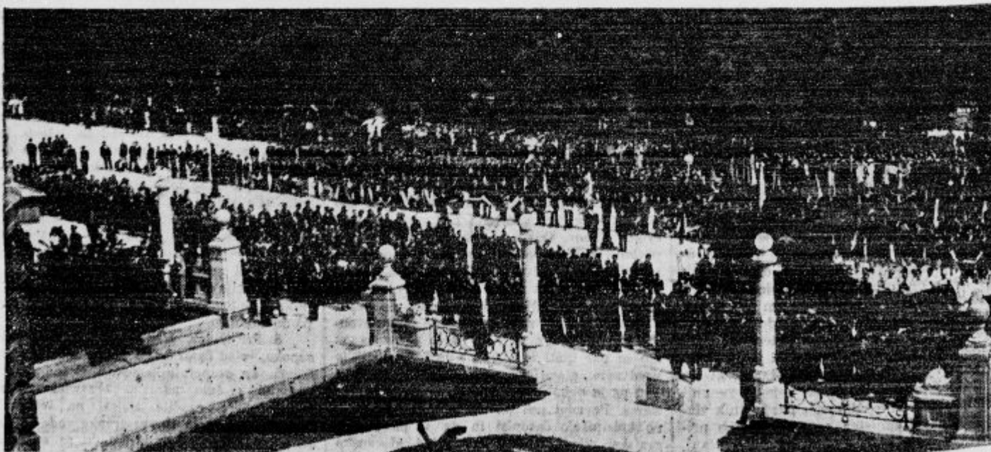
Pogrebni sprevid narodnega mučenika Dolinarja se je za kratek čas ustavil pred ljubljanskim vseučiliščem, kjer so se od rajnega poslovili akademiki

d Strela je ubila mlado gospodinjco. V torek 8. t. m. je privihrala popoldne okoli