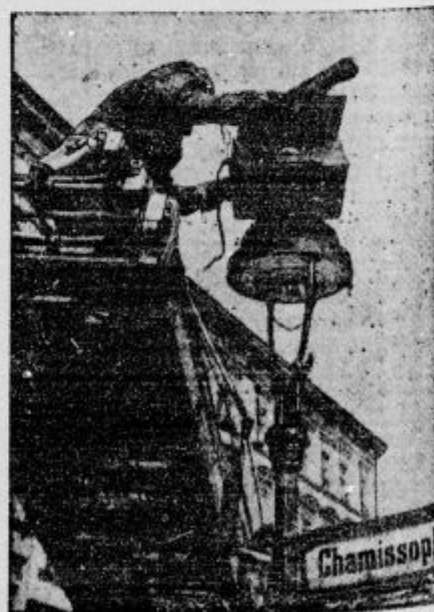
V Berlinu so meščani opazovali nedavno nenačuden prizor. Roj čebel je sedel na cestno svetilko. Poklicati so morali gasilce z lestvo, da so mogli roj ogrebeti in tako odstraniti nevarnost za ljudi, ki so hodili po cesti.