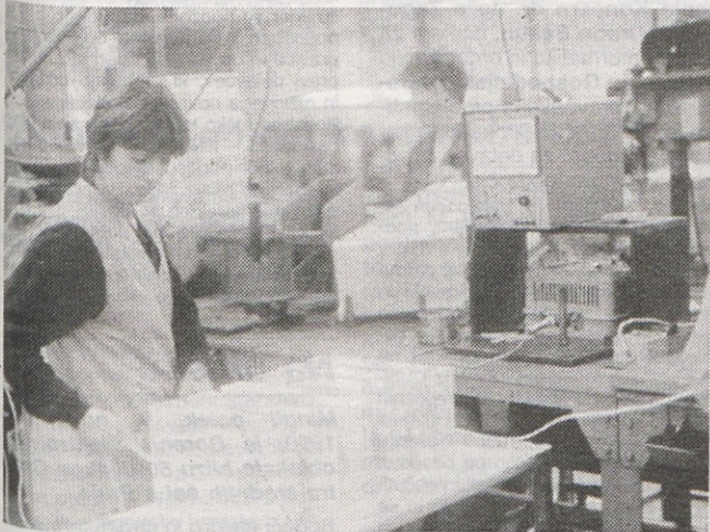
V ponedeljek, 12. novembra 1990, so poskusno stekle že skoraj vse linije v montaži Gorenja Mali gospodinjski aparati v Nazarjah.