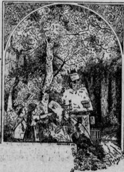
Kje je čarovnica?