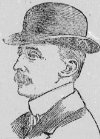
Avstrijski zunanji minister grof Otokar Czernin.

nekaj, kar sem najmanj pričakoval. Žandarju so namreč sosede natanko povedali, kdo da sem jaz in moj tovariš, ki je bil v drugi hiši nekaj minut od mene. Sumili so naju špijonaže in takih stvari. Žandar je privedel še drugega žandarja in lov se je pričel. Bil sem ravno pod streho, ko prideta in poprašujeta po meni. Povedali so jim, da sem pod streho. Že znani žandar pride gori, in ko vidi, da se oblačim — bilo je namreč zjutraj — ne reče nič in gre nazaj, misleč morda, da jaz ne vem, kaj se o meni v hiši govori, in da že pridem doli kakor po navadi, potem me pa primeta. Imel sem le še čevlje obuti, te pograbim v roke in ubežim skozi stransko luknjo na prosto — in smuk v rženo njivo in po njej v gozd v drugo vas. Tam si preskrbim spet stanovanje, zvečer pa se vrnem nazaj k tovarišu, ki je bil skrit na starem mestu. Od tu pošljem domačo deklico po svoje stvari na prejšnje mesto, potem greva s tovarišem na novo stanovanje v drugo vas. A nisva imela sreče. Ne hodi divja še dolgo, ko zapaziva žandarja pred seboj. Zaradi noči jih nisva prej zagledala, kakor na petdeset korakov. Tovariš mi je naglo rekel, da bi streljala. Kaj, da bi ujet-