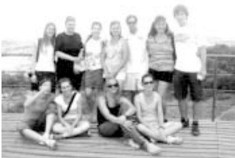
Požrtvovalni voditelji. Hvala vam!