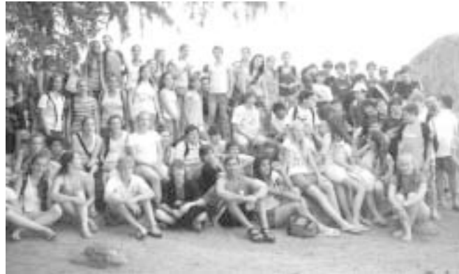
Res lepa skupina se je zbrala na taborjenju

Suho drevo smo hoteli predstaviti kot našo skupino, naše prijateljstvo v skupini. Tako, kot prijateljstvo potrebuje sodelovanje nas vseh, da raste in se krepi, drevo potrebuje sonce, vodo, zrak, da postane lepše. Na papir v obliki lista smo pisali besede, ki so nastale v skupini kot: družina, molitev, odpuščanje, spoštovanje. Te liste smo potem obesili na drevo in ga s tem oplešali. Upamo in želimo, da bi tudi