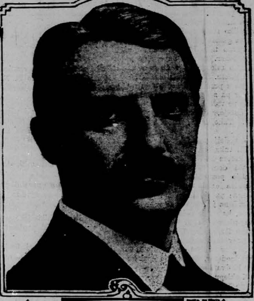
novi ameriški državni tajnik.