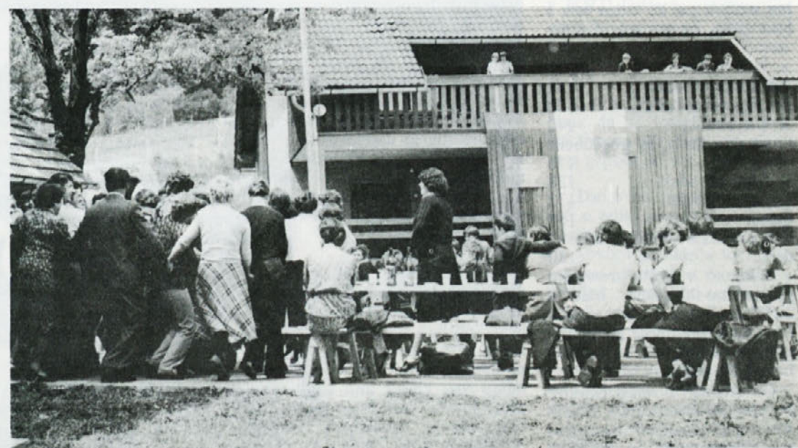
Po končanem kvizu smo ob igranju vojaškega ansambla zaplesali sprva po dva in dva, nato pa smo se strnili v kolo.