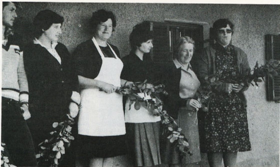
Pionirji so jih klicali kat „tete“, le „tovarišu“ tega imena niso mogli nadeti. Ob slovesu so se s šopkom zahvalili za skrb in delo in izrekli upanje, da se bodo ob letu spet srečali na Sromljah.