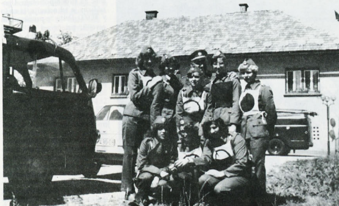
Posnetek gasilske skupine na republiškem tekmovanju tekstilnih gasilskih enot. Med 50 ekipami je naša dosegla 9. mesto.

Da posvetijo toliko svojega prostega časa delu v gasilski skupini, mora biti med članicami gotovo veliko navdušenja. Same pravijo, da rade trenirajo, da jim ni žal časa, ki ga preživijo v prijateljstvu, veselem in prijateljskem vzdušju. Želijo si, da bi se čim več deklet vključilo v njihovo skupino, kjer ne goje samo gasilskih veščin, pač pa tudi prijateljstvo.