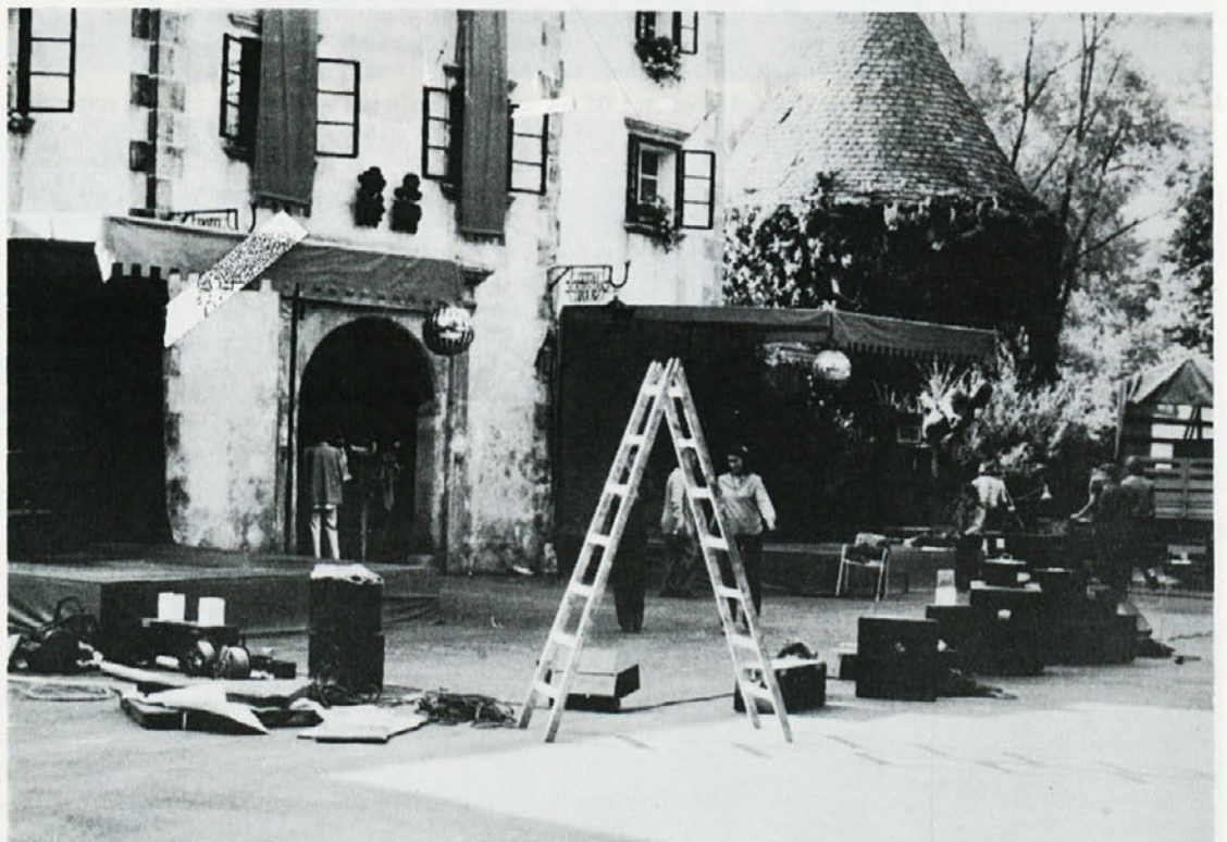
Da bi bilo vse na red za večerno modno revijo, je s pripravami treba začeti zgodaj. Prvi dan je dež presenetil, že postavljeni oder se je moral preseliti pod streho v restavracijo. Drugi večer pa so imeli organizatorji več sreče.

Drugi večer so imeli organizatorji več sreče. Bakle na mostu so osvetljevale vrsto, sicer stiroporastih Labodov, ki so simbolizirali ime naše delovne organizacije. Prikaz kolekcije pred gradom Otočec je bil izredno učinkovit, pogost in navdu-