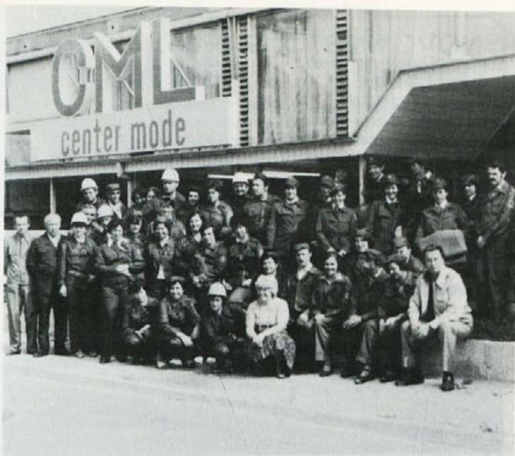
V juniju so člani CZ TOZD TIP-TOP sodelovali v vaji krajevne skupnosti stadion.