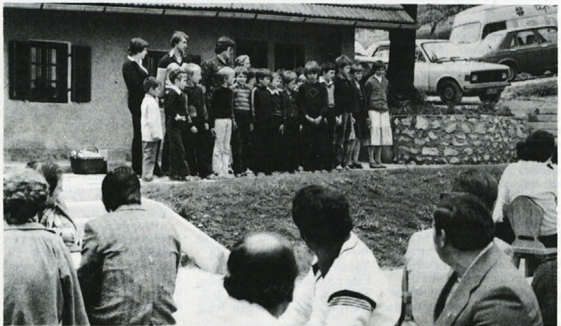
V desetih dneh so postali prijatelji in čeprav je domotožje včasih dan prepočasno obračalo, se je bilo na koncu kar težko raziti.