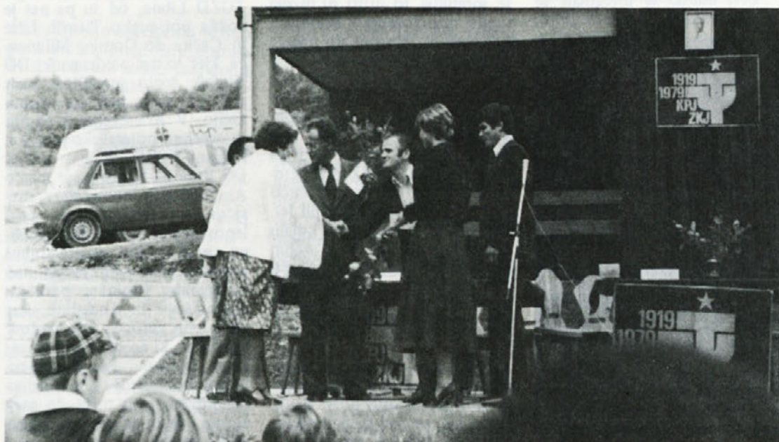
Članom ZK, ki delujejo v partijskih vrstah že 30 let, so sekretarji predali priznanja.