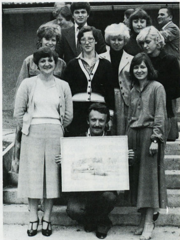
Vse ekipe pokazale precej znanja, s točko prednosti pa je zmagala skupina TOZD Commerce.

Vsa leta od 1968–1977 pa so bolezni srca in ožilja na prvem mestu kot vzrok invalidnosti I. in II. kategorije, bolezni kosti, mišic in vezivnega tkiva pa so kot vzrok invalidnosti III. kategorije na prvem mestu. Struktura najpogostejših vzrokov invalidnosti se od leta 1968–1977 ni bistveno spremenila in je patologija naših invalidov v desetletnem obdobju enaka in ne kaže kakšnih posebnih odklonov.