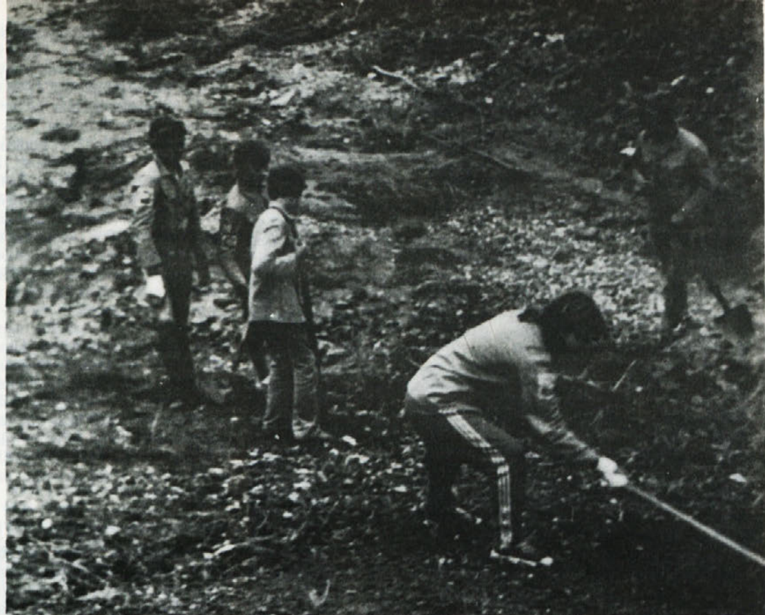
Novomeška brigada si je priborila vrsto priznanj.