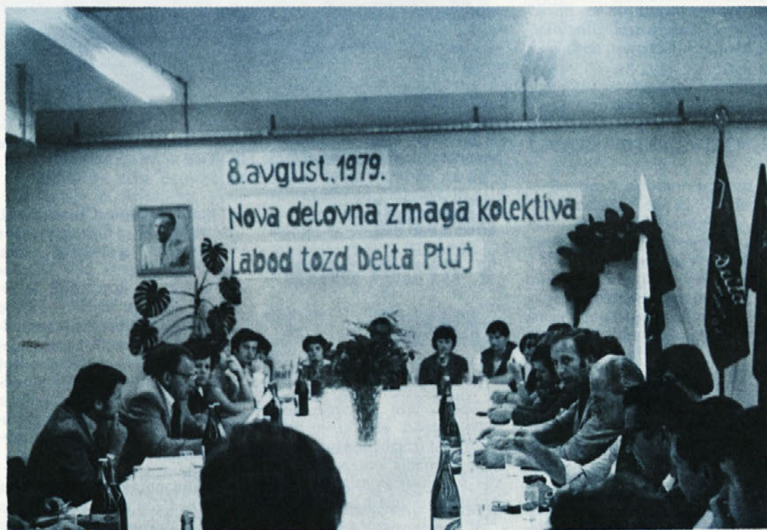
V novih prostorih je imel sejo delavski svet delovne organizacije Labod.