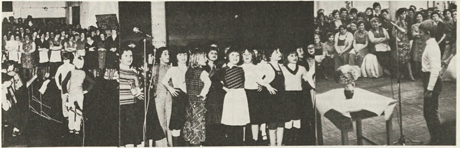
Proslave dneva žena v naši tovarni, ki jih prirejajo učenci osnovne šole Dušan Kveder Tomaž Litija, so postale že tradicija. Na sliki: proslave iz leta 1978, 1979 in 1980.