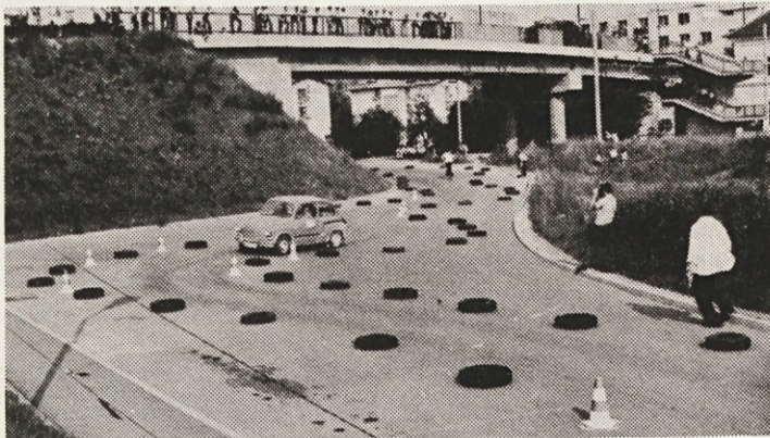
Avtomobilski šport je ena od dejavnosti AMD Litija