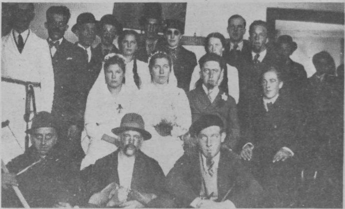
Gledališka skupina iz Javora, ki je pred 35-timi leti uprizorila komedijo Lumpacius Vagabundus

Takoj po vojni pa se je gledališka skupina – sedaj kot KUD France Prešeren – ponovno formirala in postavlja vsako leto na oder dve do tri predstave – žal zadnji dve leti le po eno. Sodeluje tudi na reviji gledaliških skupin naše občine ter gostuje v sosednih krajih. Gledališka skupina v Javoru ima 43 delovnih članov, kar je pokazala tudi letošnja revija, ki se je zaključila v njihovem kraju. To je tudi garancija za njihovo nadaljnje delo. Ob njihovem jubileju jim vsi od srca čestitamo, posebno še druge gledališke skupine občine Moste-Polje, in jim želimo nadaljnega uspešnega dela.