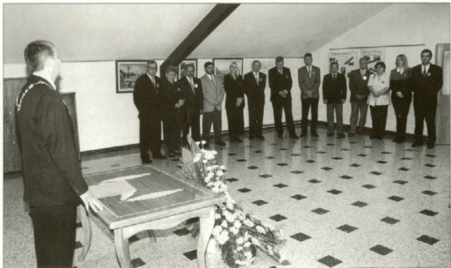
Svetniki so se zbrali na svečani seji in svečano potrdili dobitnike priznanj in dobitnika plakete.