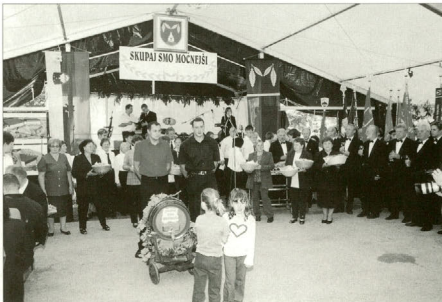
Otroci so pripeljali sodček z vinom v prireditveni prostor, gospodinje pa so prinesle pecivo.

Ta dan ni manjkal tudi pester kulturni program. Pripravili smo ga v Kulturno-umetniškem društvu Majšperk. Hoteli smo vključiti čim več društev, saj smo samo tako lahko uresničili geslo: "SKUPAJ SMO MOČNEJŠI." Zarajali so otroci iz vrta Majšperk, Ljudske pevke iz Sestrž in iz Stoperc so nam