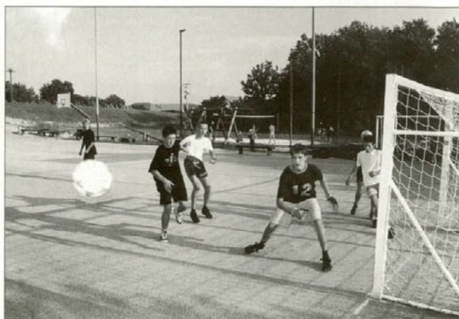
Utrinek iz nogometne tekme.