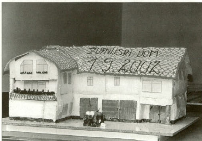
Torta v obliki župnijskega doma.