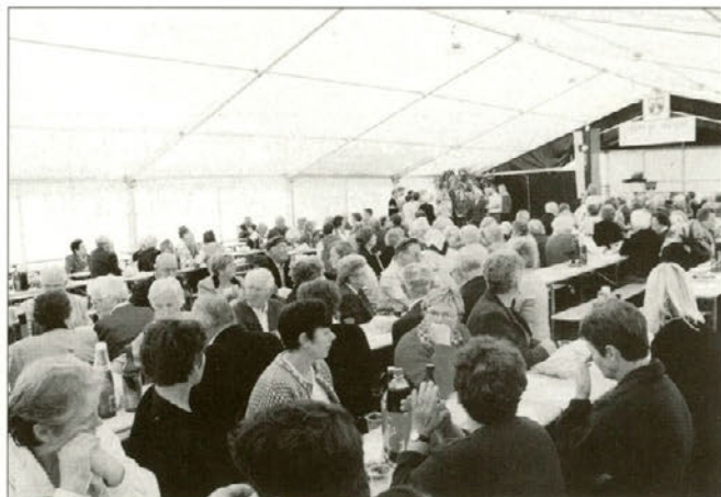
Utrinek s srečanja starejših občanov.

Pri maši je sodeloval domači pevski zbor, ki je z lepim ubranim petjem polepšal že tako lepo prijateljsko srečanje. Kar prehitro je minilo druženje v cerkvi.