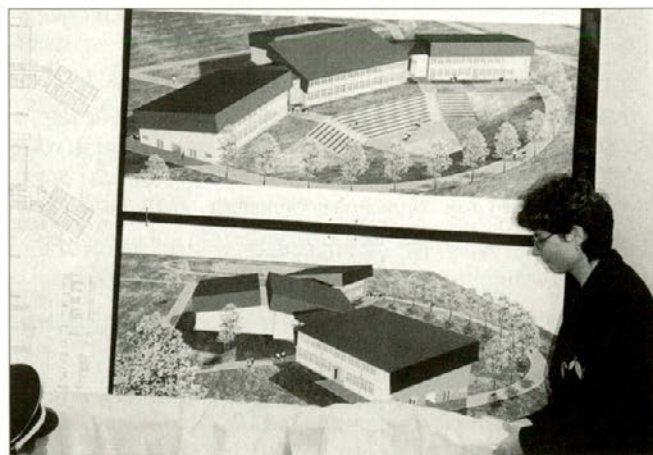
Prisotni so ostrmeli, ko smo razkrili "sliko nove šole" in jo pozdravili z aplavzom.