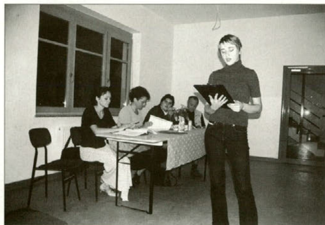
Utrinek iz literarne delavnice.

Komisija literarnega natečaja "PESEM 2002" pa vsem, ki radi pesnijo in kujejo verze, sporoča: