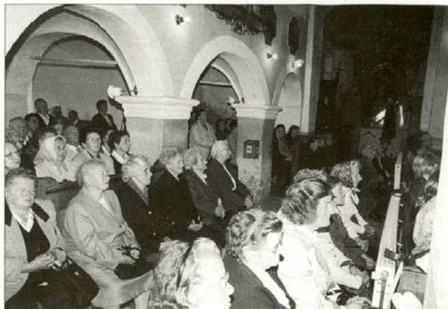
Utrinek s srečanja starejših občanov.

Po maši v cerkvi smo se preselili pred občino, kjer se je srečanje nadaljevalo. Ogledali smo si razstavo, ki je bila pripravljena v okviru občinskega praznika. Lepo je bilo in zanimivo. Z veseljem smo si ogledali vse, kar je bilo razstavljeno.