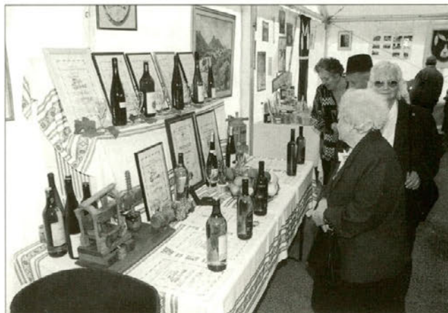
Utrinek iz razstave.