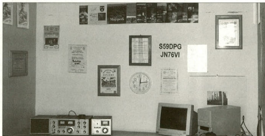
Klubski prostori Radiokluba Ptujška Gora.