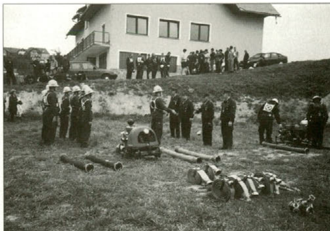
Utrinek iz gasilskega tekmovanja.