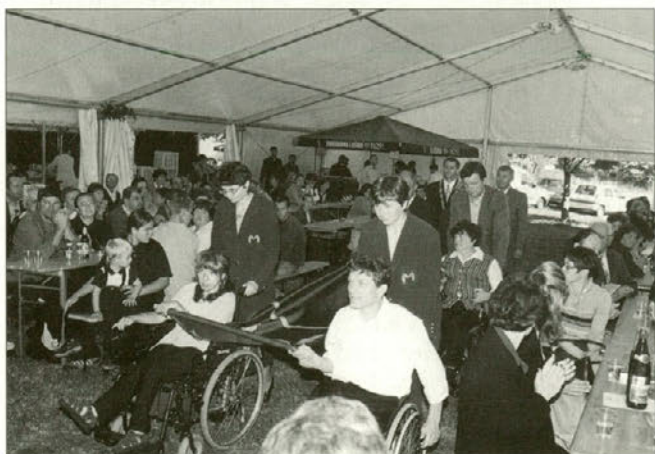
Prihod zastave v prireditveni prostor.