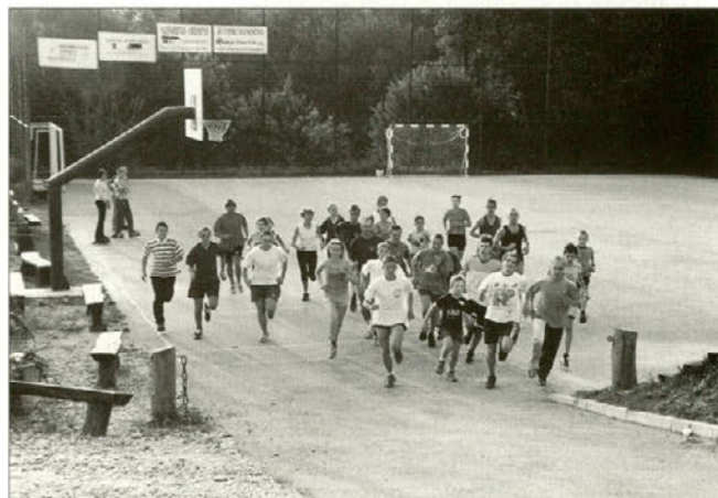
Utrinek s pričetka "šprinta".