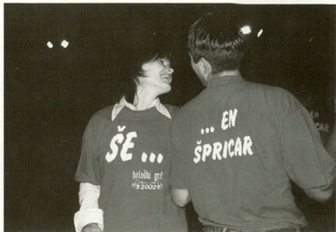
Letošnji naziv iger je bil "ŠE ..... EN ŠPRICAR".

Organizator prireditve KUD Majšperk je novemu haloškemu grofu podaril prelepo leseno puto ter nagrado sponzorja gostilne DOLINCA Marčič. Nato pa oba oblekel še v majico z geslom letošnjega tekmovanja: "ŠE ..... EN ŠPRICAR".