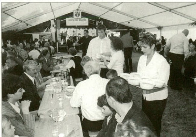
Vsi prisotni so dobili brezplačno malico.