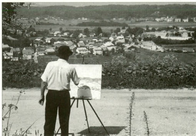
Utrinek iz likovne delavnice.