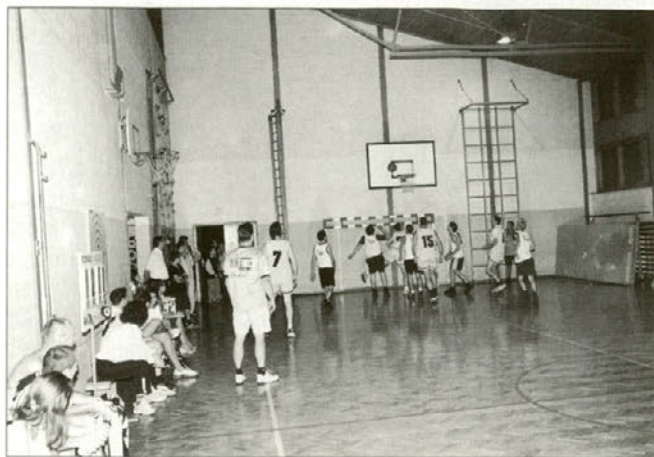
Utrinek iz košarkarskega turnirja.

zahtevale veliko smeha, manjkala pa ni niti jeza ekip, saj so ekipe vzele igre zelo resno. Na koncu je slavila zmago ekipa Smo al nismo pred ekipo ŠD Podložje in ekipo Sončki .