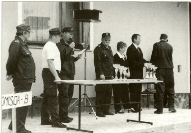
Pričetek podelitve priznanj.