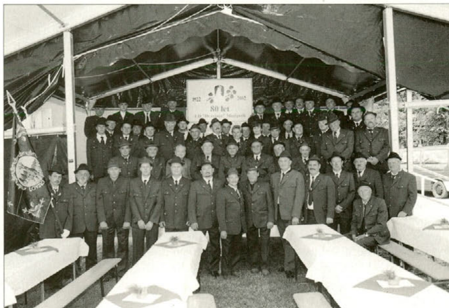
Prisotni člani na praznovanju.