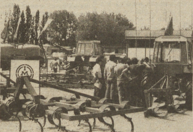
Naša največja kmetijska manifestacija, jubilejni 50. mednarodni kmetijski sejem v Novem Sadu, je bil prava paša za oči številnih obiskovalcev.

Pa saj je bil vendar izlet, in ko se srečajo stari znanci, mora biti prijetno. In prepričani smo, da to prijetno popotovanje ni bilo zadnje.