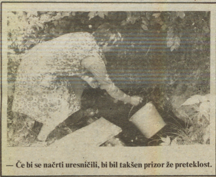
— Če bi se načrti uresničili, bi bil takšen prizor že preteklost.

Pa tudi sicer v vasi ne veje več toliko družabnega vetra kot pred leti in starejši vaščani se nostalgčno spominjajo časov, ko so bili deležni prave pozornosti. Kmetje so v teh dneh tudi malce zbegani. Toliko so slišali, prebrali o pripravah na sprejem novega zakona o pokojninskem in invalidskem zavarovanju, nihče pa se ni potrudil, da bi jim novosti, ki jih bo prinesel, razložil, skratka, organiziral razpravo. So za vse to krivi le oni? V. Paveo