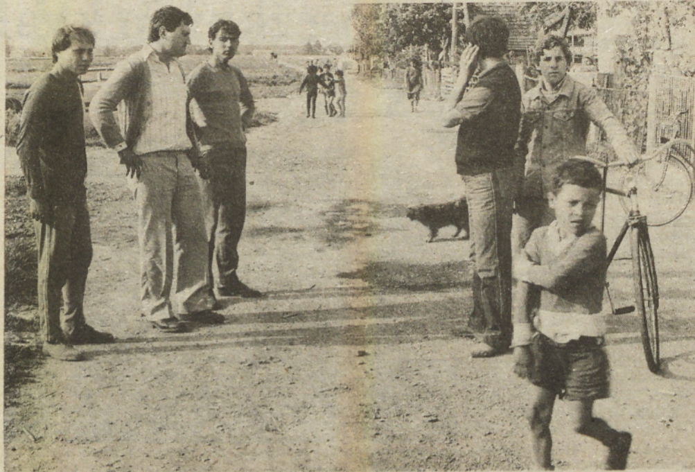
Ob naselju je vedno tako. Živahno. Če se ustavite, pa jim nikar ne zamerite skoraj obveznih vprašanj: Koga iščete? Zakaj? Od kod ste? itd. Samozaščita, ki jo mnogokje celo pogrešamo.

Preskrba z dobro pitno vodo je v zaselku največji problem, zato ga bodo začeli s sredstvi iz krajevnega samoprispevka in širšo druž-