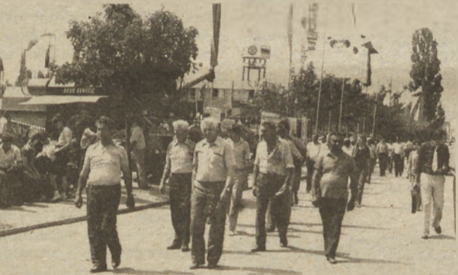
Veliko bi naši kmetije želeli še videti, a kaj, ko je bilo časa premalo.

nepozabno doživetje. Nekateri so prišli v naše glavno mesto tokrat prvič, nekateri so se srečali z njim po tridesetih, štiridesetih letih. Oko bega po visokih stolpnih skoraj dvamilijonskega mesta, kot da ne more verjeti dosežkom tehnike ob pogledu na Gazelo. Prelep je raz-