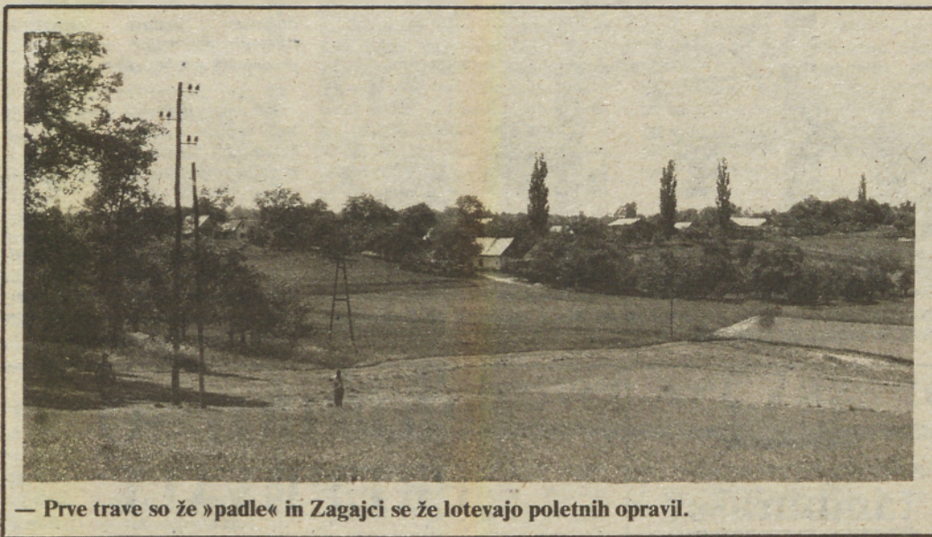
— Prve trave so že »padle« in Zagajci se že lotevajo poletnih opravil.

drugimi potegnili kratko tudi v Zagajskem vrhu.«