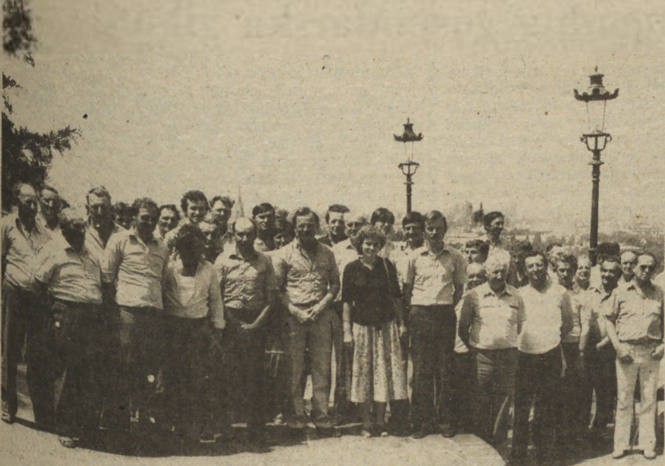
Se spominjska fotografija na Petrovaradinu in že se je bilo potrebno posloviti od Novega Sada.

Za marsikoga je bila noč prekrajka, saj že navsezgodaj nadaljujemo pot proti No-