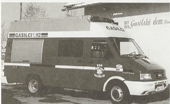
Novo gasilsko vozilo je v ponos vsem gasilcem in celotni Slovenji vasi.

Vsi razpravljavci so PGD Slovenje vas čestitali ob doseženih uspehih v letu 1999. Zaželeli so nam čim manj oziroma nič požarov ter še veliko uspehov in sodelovanja v letu 2000.