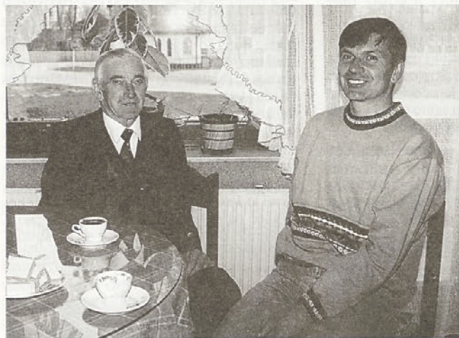
Ob kavi se nam je skozi okno nudil lep pogled na kapelo sredi vasi