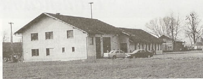
Dom vaščanov je trenutno še brez obleke. Ob prvomajskem slavlju pa bo že vse drugače.

Današnja mlada generacija si le težko predstavlja, kako je ob pomanjkanju denarja in mehanizacije potekala elektrifikacija vasi, kako so slovesno predali svojemu namenu prve kilometre asfaltiranega cestišča, kako je bilo, ko so napeljali vodovod do poslednje hiše na Habriču, ko so priključili zadnji telefonski aparat. Le težko bodo razumeli, da je bilo takrat hudo za vse, tudi za tiste, ki so imeli kmetije. Imeli pa so neomajno voljo, voljo, ki je bila nalezljiva, ki so jo širile predvsem ženske in vaški gasilci. Ni bilo pomembno, da so delovali kot gasilska desetina Draženci pod okril-