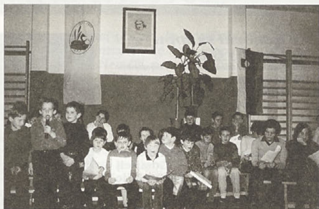
Literarni večer v šolski telovadnici