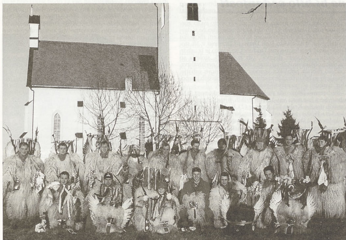
Pokazali in predstavili so se marsikje.