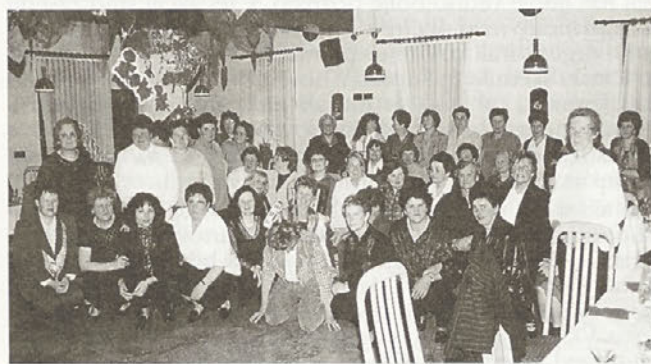
Materinski dan po hajdoško v Slovenji vasi