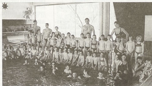
Hajdinski prvošolčki na plavalnem tečaju v Termah Ptuj