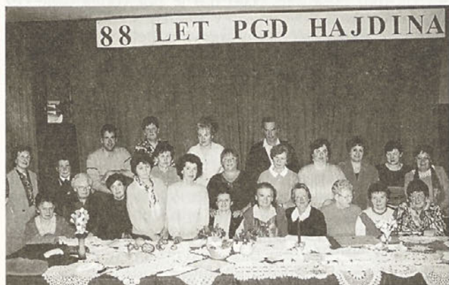
Na tečaju ročnih del je bilo vedno toliko udeleženk, kot na sliki ob zaključku