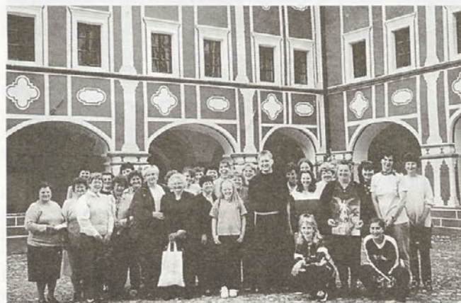
Tako je bilo v Olimju. Kam pa gredo Draženčanke v maju?

Kljub temu, da smo zadnje ustanovljeno društvo na vasi, so naše članice zelo delovne in pripravljene sodelovati na vseh področjih. Na prvem občnem zboru smo začrtali smernice dela za leto 2000 in podale poročilo o delu za minulo leto. Rezultati so vidni – kuhamo in pečemo v zimskih mesecih (od vseh vrst mesa, omak, solat, potic, krofov, do raznega peciva), organiziramo različna predavanja (na temo zdravstva, vrtnarjenja, oblikovanja raznih aranžmajev...), udeležujemo se strokovnih ekskurzij in razstav, skupaj s Hajdinčankami in Hajdošankami smo poskrbele za predstavitev "jedi danes" na proslavi ob 100-letnici otvoritve I. mitreja na Spodnji Hajdini; povezale smo se v Zvezo kmetic Slovenije, z ostalima dvema društvoma sodelujemo na tedenski rekreaciji na OŠ Hajdina. Nekatere naše članice