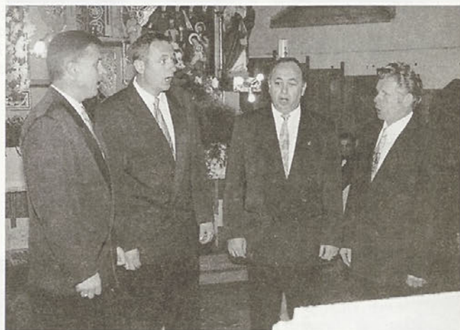
Kvartet 2x2 nikoli ne odkloni sodelovanja in za svoje neumorno kulturno poslanstvo vedno požanje zasluženi aplavz.

V smernicah za leto 2000 smo kot prvi večji projekt v mesecu maju predvideli regijski kviz "POKAŽI KAJ ZNAŠ", na katerem bodo sodelovala vsa kulturna društva v naši in tudi drugih občinah. Že sedaj vas nanj vladno vabimo. Pripravljamo se tudi na proslavo praznikov žensk, v poletnem času pa bomo nadaljevali s počitniškimi delavicami, sodelovali na občinskem prazniku, kulturnem večeru,