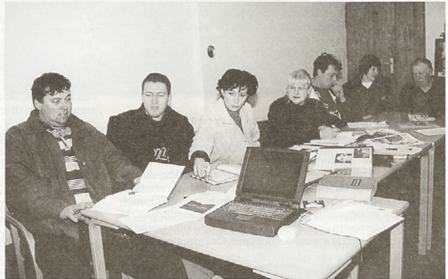
Vsem "sodelavcem" za pripravljenost in pomoč najlepša hvala!

Andrej DREVENŠEK je znan po tem, da se kot strojni tehnik ukvarja s