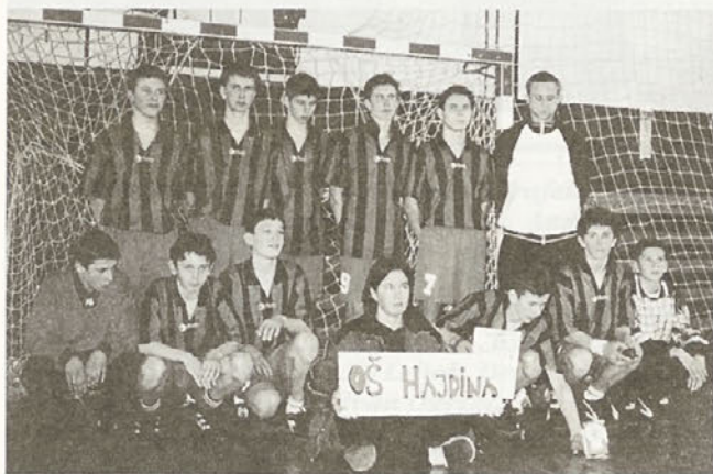
Naša ekipa je prejela tudi priznanje Športne zveze občine Hajdina kot EKIPA MALEGA NOGOMETA OŠ HAJDINA za 1. mesto na področnem tekmovanju.