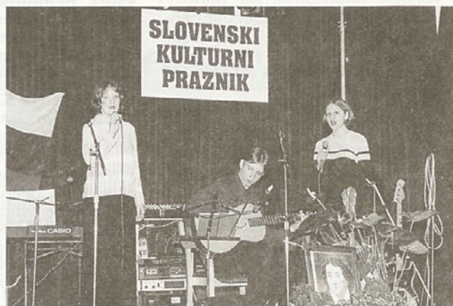
V očetovo rojstno vas Draženci radi prthajajo tudi otroci Jožeta Gojkoška. Zaigrali in zapeli so na proslavi ob kulturnem prazniku.