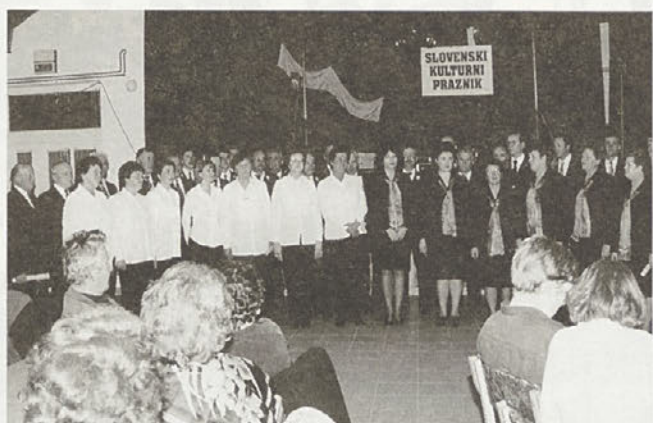
In kaj mislite, katero so zapeli vsi združeni pevci ob koncu srečanja? Trikrat lahko ugibate