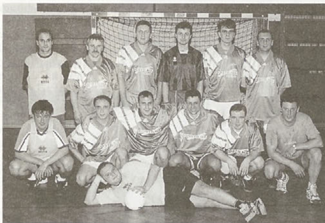
Ekipa Dražencev med turnirjem v malem nogometu ob prvem prazniku občine Hajdina

Zaradi zelo dobrih uspehov v ligi malega nogometa so naše ambicije zrasle, saj se je v Dražencih ponovno porodila želja po igranju velikega nogometa. Vabim vse zainteresirane, da pristopijo k društvu in po svojih močeh pomagajo pri uresničitvi tega velikega cilja, ki sploh ni nedosegljiv.