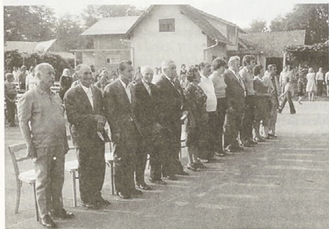
Leta 1977 so se Draženčani zbrali na slovesni otvoritvi starega doma vaščanov, ki je v resnici postal drugi dom vsem, ki so želeli za vas narediti karkoli dobrega. In tega ni bilo malo!

jem Gasilskega društva Hajdina, važno je bilo to, da se je nekaj dogajalo, kar je prinašalo vasi boljše življenje.