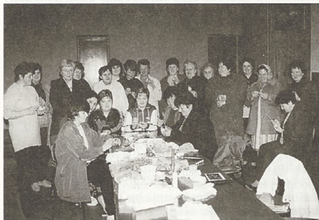
Prvi četrtek v aprilu je bil namenjen barvanju pisank. Naše izdelke lahko vidite tudi na naslovnici.

Sedaj smo v fazi registracije društva, imamo svoj znak – sončnico, ki simbolizira svetlobo, življenje, hrano – k čemur teži tudi naše društvo.