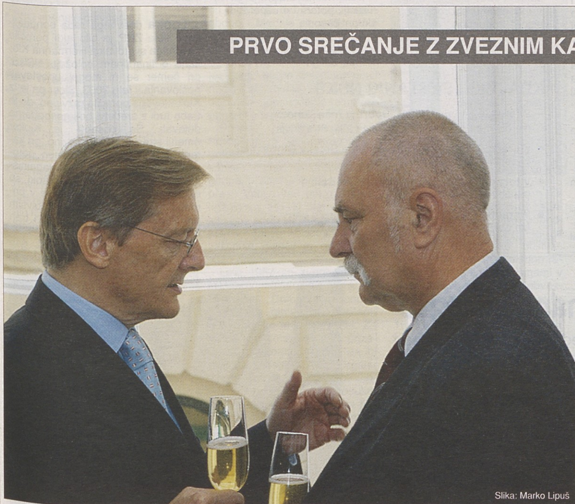
Slika: Marko Lipuš

Pretekli petek so na Dunaju slovesno odprli obnovljeno Knaflijevo hišo.