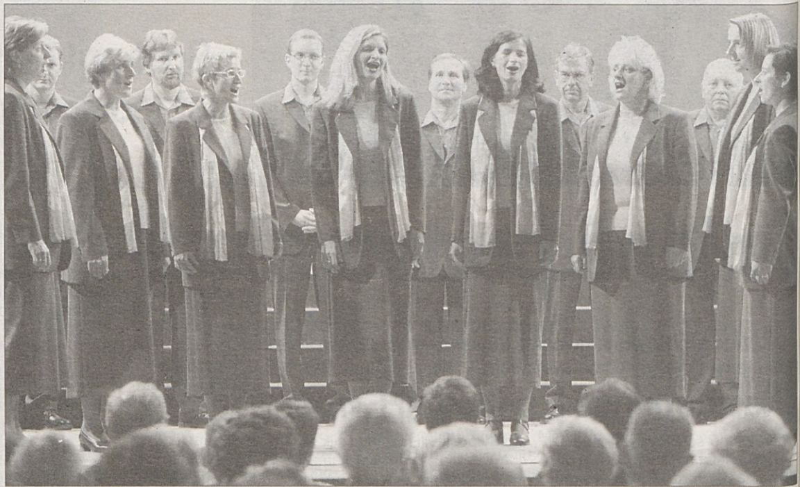
V Mariboru so nastopili koroški zbori: v ospredju skupina Pet in tri, zadaj MoPZ Trta.

Tradicionalno srečanje obeh koroških kulturnih organizacij s Klubom koroških Slovencev v Mariboru je preteklo soboto, 17. maja, s pevsko revijo Koroška poje potekalo v dvorani Union.