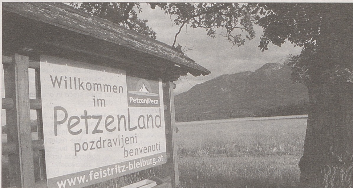
„Petzenland - dežela pod Peco“ – po mnenju izumitelja imena je dežela pod Peco večja od občine Bistrica, ki je z njo zaznamovala svoje občinske meje. Zdaj naj bi tablo odstranila.

■ Veliko „hitrih“ časopisov na Bistrici ■ Kje se pričrne „Dežela pod Peco“ ■ Bodo slovenske občine že kmalu prehitele Koroške? ■ Vandalizem v Škocjanu