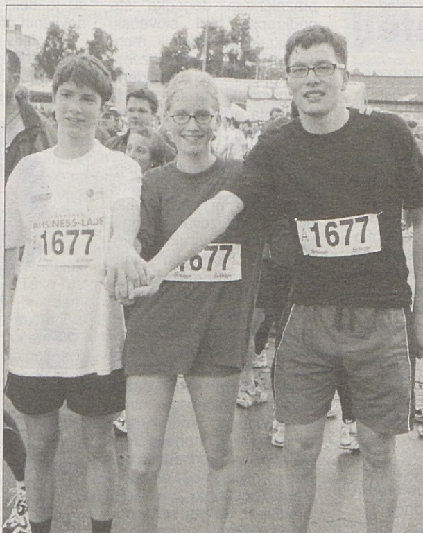
Borbenost in dobri vremenski pogoji so omogočili, da se je skupina Slomškovega doma od 150 ekip uvrstila na odličnem 11. mestu.