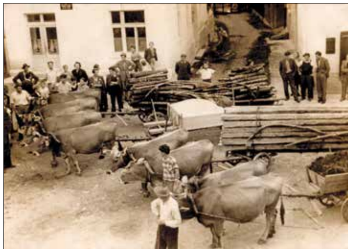
Tekmovanje kravjih vpreg pri prevozu tovora, 1953