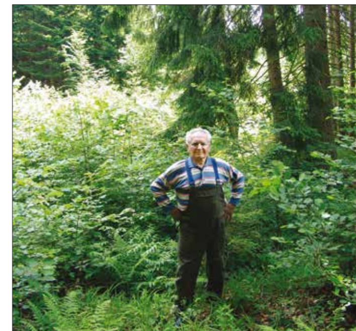
V tej z grmovjem močno zaraščeni dolinki v Pasji dolini nad Krvavo Pečjo je zložena Rihtarjeva gozdna apnenica.