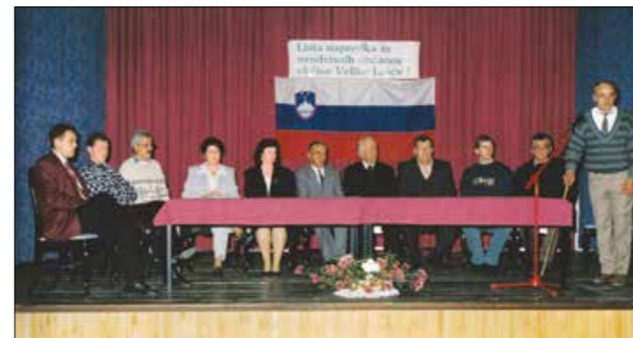
Prvi kandidati NEODVISNE liste