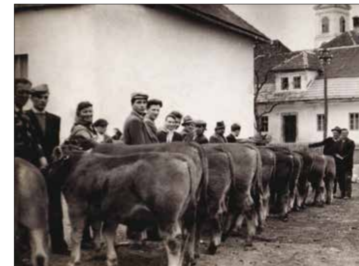
Semenj plemenskih bikov v Laščah, 1953

Njegov ponos so bile krave sivorjave pasme. Vodil jih je na razstave in dosegal visoka mesta. Najbolj ponosen je bil na kravo Baro, ta je dobila najvišjo oceno – 1 A. Ko smo pasli krave ali vodili napajati h koritu, je bila Bara vodnica celi čredi.