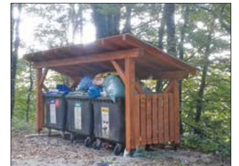
Ekološki otok v Dolnjih Retjah

Na območju občine imamo 30 lokacij ekoloških otokov. Od tega jih je 11 urejenih z nadstreškom. V tem mesecu je bil na novo urejen ekološki otok v Dolnjih Retjah, z nadstreškom pa se urejata tudi lokaciji ekološkega otoka pod gradom na Turjaku in na Malem Ločniku.