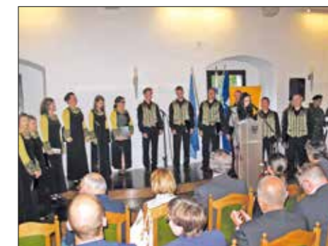
Velikolaška vokalna skupina