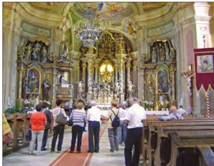
Letna cerkev Matere Pomočnice na Hribarci