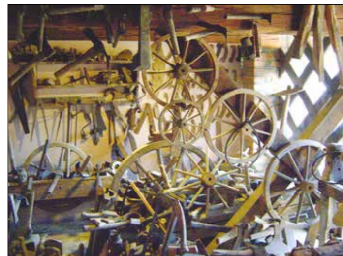
Zbirka orodja kolarjev