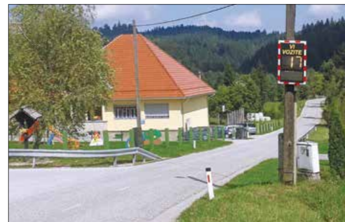
Merilec hitrosti na Karlovcici

Meritve so analizirane v obdobju od 21. do 28. julija 2014 na Karlovcici, kjer je hitrost omejena na 50 km/h. Povprečna hitrost vseh zaznanih vozil v analiziranem obdobju je 41 km/h, maksimalna pa 70 km/h, ta je bila izmerjena dvakrat. V celotnem obdobju meritev je 85 % vozil vozilo do hitrosti največ 50 km/h. V opazovanem obdobju je radarska tabla zaznala 814 vozil. Največja obremenjenost ceste na Karlovcici je bila med vikendom (sobota, nedelja), ko je bilo v povprečju zabeleženih 6 vozil na uro. Med delovnim tednom (od ponedeljka do petka) je prometna obremenjenost ceste rahlo nižja. V primerjavi z vikendom je radarska tabla