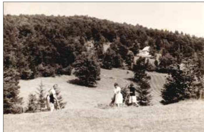
Prva košnja s kosilnico v retenskih snožetih, 1958