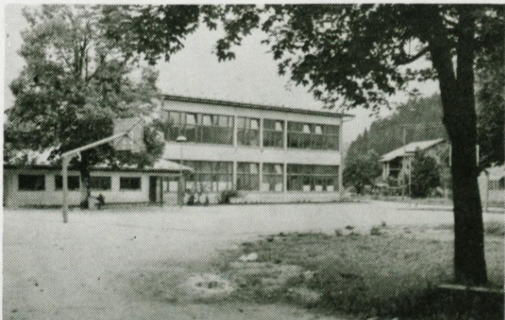
Počitniško tihožitje