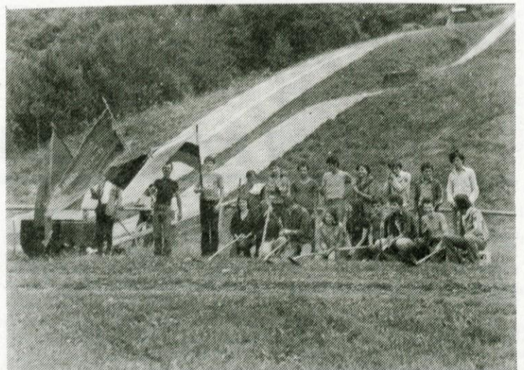
Kot odskočna deska v pripravah na Republiško MDA je logaškim brigadirjem služila prava skakalnica...