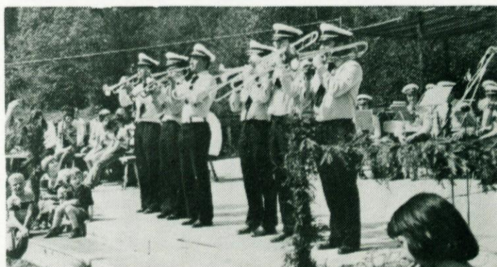
Fanfara logaških godbenikov so naznanile razvitje planinskega prapora