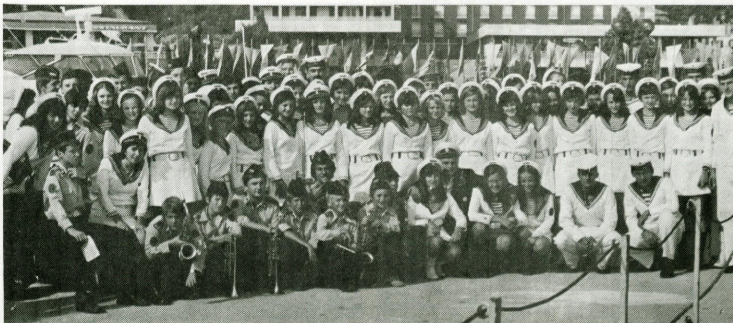
Množičnost in kakovost sta osnovni karakteristiki ansambla mladih glasbenikov Logatec