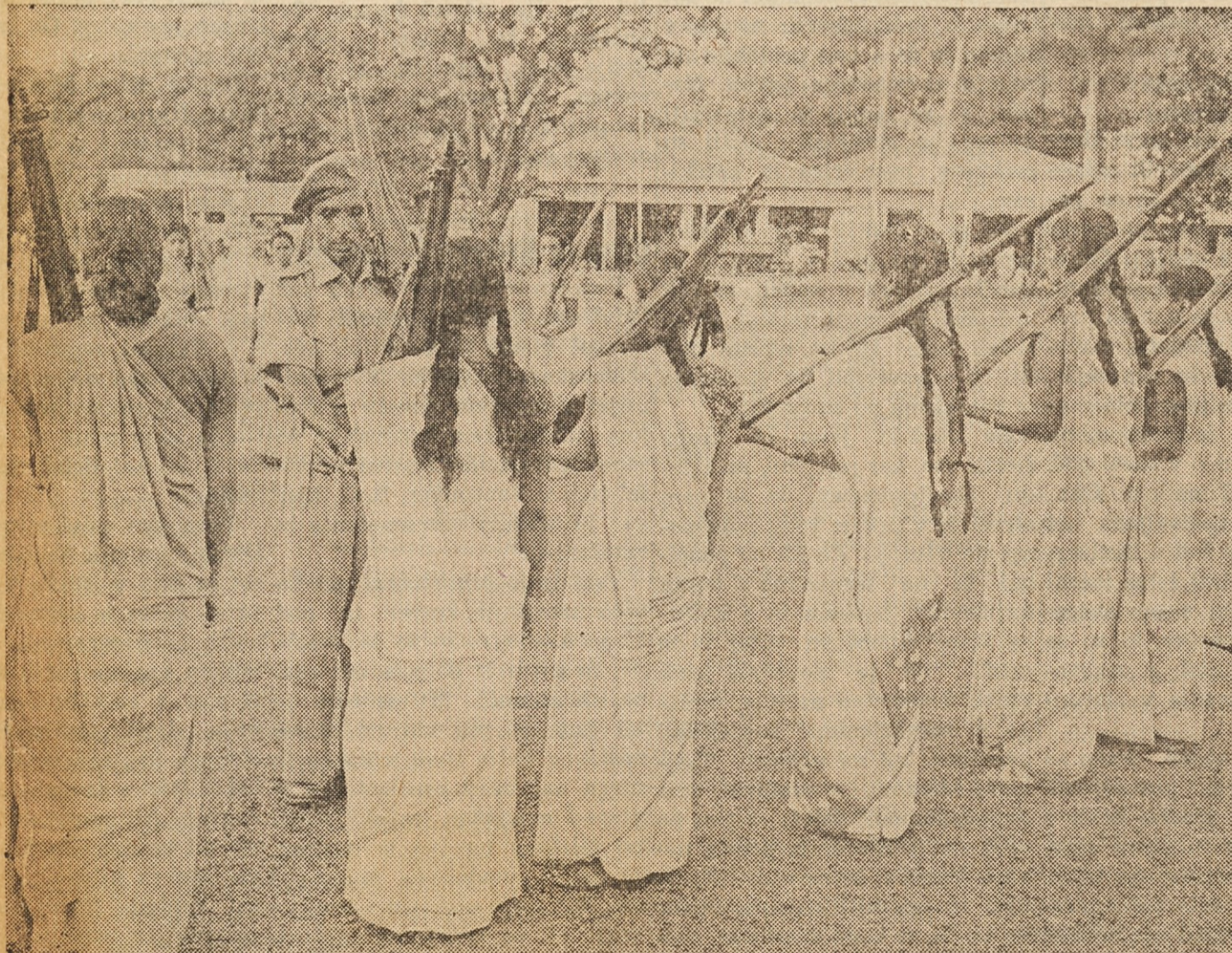
NEBOJEVITI IZGLEDE — Indijke se uče v uporabljanju strelnega orožja za slučaj izredne potrebe. Pri tem so kar v svoji običajni obleki "sari", kot kaže prizor na sliki posneti na vežbališču "Domače straže" v Tezpurju.