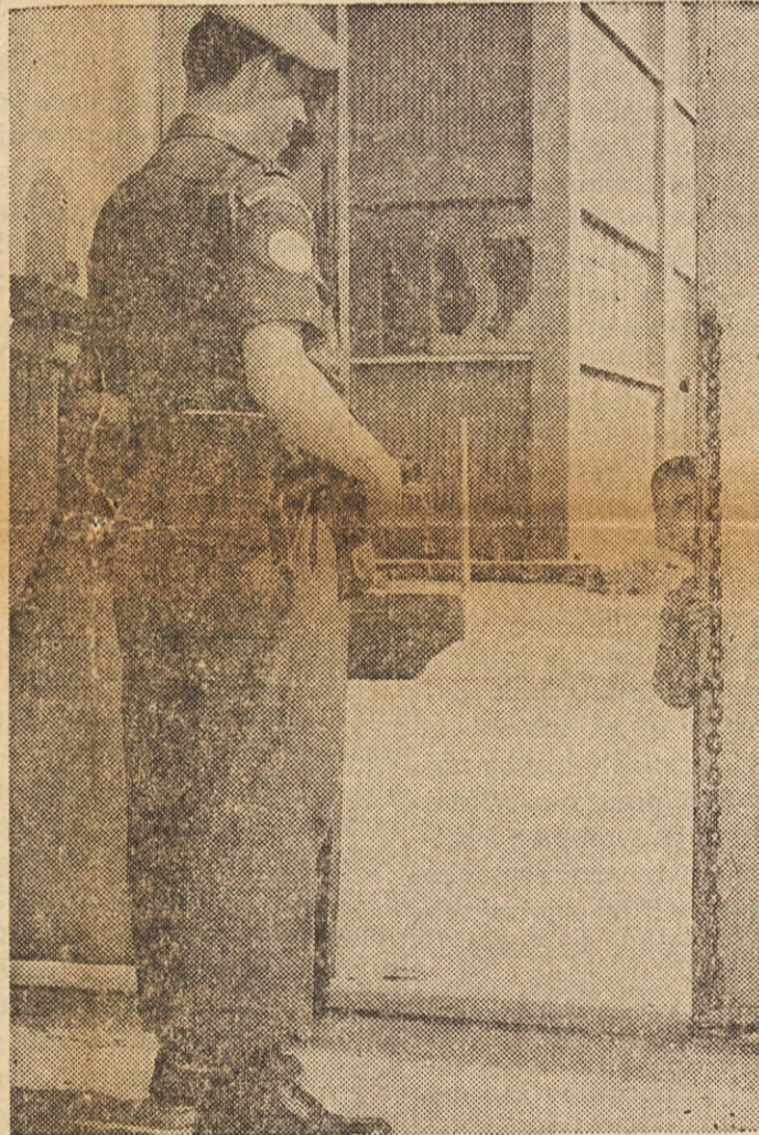
OTROŠKA RADOVEDNOST — Turški dečko na Cipru si izza ogla ogleduje kanadskega vojaka, ki v okviru čet Združenih narodov pomaga vzdrževati mir med Turki in Grki na otoku.