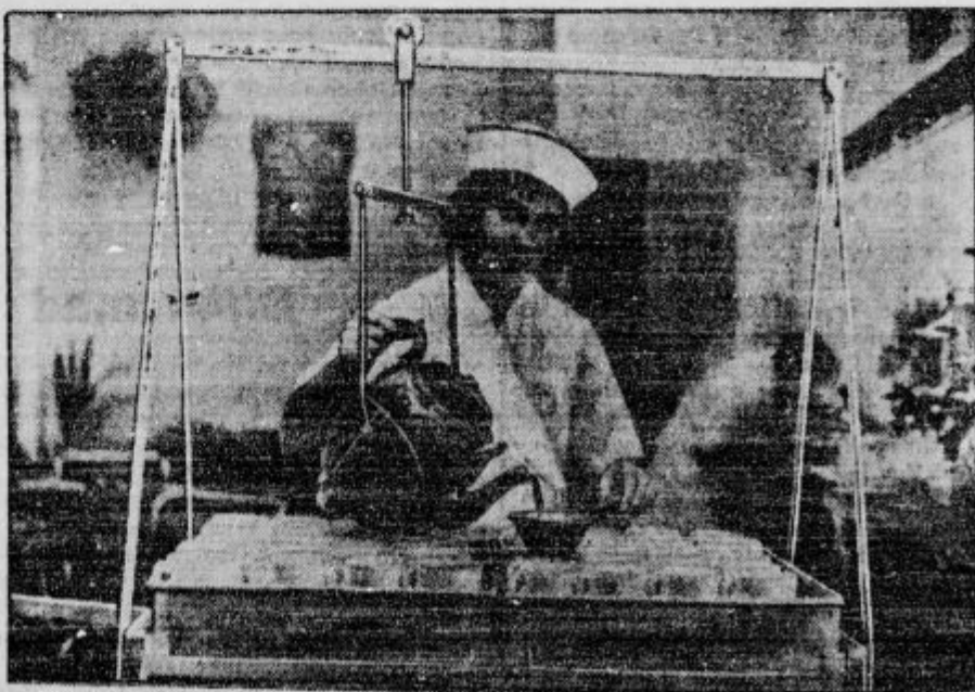
Angleži zelo radi pijejo čaj. Zato imajo s točno potrebo največkrat čajavo. Da bi gostom po londonskih gostinah in kavarnah mogli čimprej postreči, so izumili tale viseči in »potujoče vrč«, iz katerega lahko v eni minuti nalijejo 150 »kodelle čaja. Če kuharica ni dovolj pripravna, najbrž tudi ta najnovejši izum mnogo ne pomaga

s Obiski francoskega zunanjega ministra. Francoski minister za zunanje zadeve je te dni obiskal Poljsko, Romunijo in Jugoslavijo. Razgovori s poljskimi državniki pomenijo, kakor tudi časopisje, utrditev poljsko-francoskega prijateljstva. Vprašanje obstoja Zveze narodov je ostalo nerešeno, saj je ta ustanova