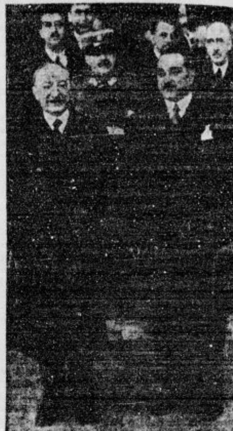
Francoski zunanji minister Delbos je te dni obiskal Belgrad, kjer so ga slovesno sprejeli.

d Divjanje steklega psa. Nedavno je prišlo iz Ceremošnjic v novomeskem okraju poročilo, da se klati po cesti proti Črnomlju stekel pes, ki se je v resnici pojavil dopoldne v Črnomlju. Napadal je ljudi, ki so po svojih opravkih hodili po mestu. Pes je skakal na ljudi in jih grizel po večini v roko. Ko je napadel neko dekle, je ni hotel izpustiti, dokler ga ni s silo