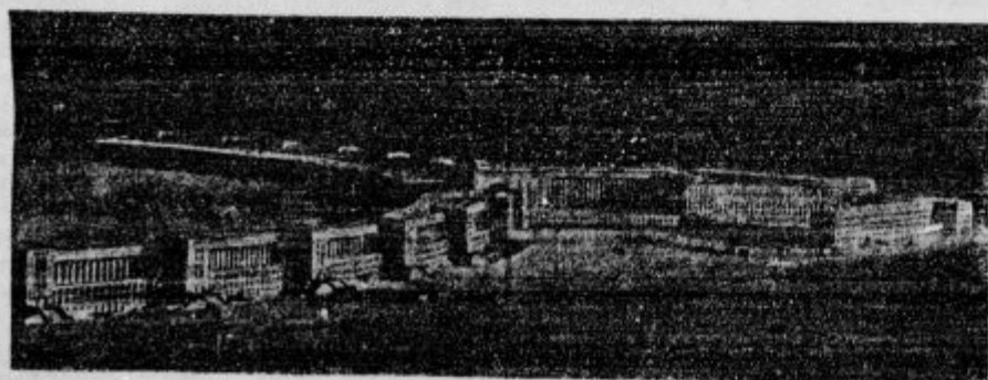
Največje letališče za zrakoplove na svetu ima nemško glavno mesto Berlin.

d V globino je strmoglavil. Ono nedeljo popoldne se je igrala na dravski brvi skupina mladih fantov. Med njimi je bil tudi 19 letni brezposelni Zorko Kravos, ki je za šalo skočil