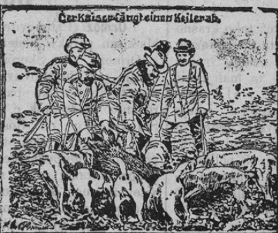
Bilder von der Hofjagd in Springe