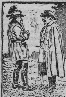
Kaiser Wilhelm u. Erzherzog Franz Ferdinand in Springe

Pred par dnevi obiskala sta nadvojvoda Franc Ferdinand, avstrijski prestolonaslednik, in nadvojvoda Friderik nemškega cesarja. To priliko se je porabilo za veliki lov pri Springe. Velikost tega lova je iz tega razvidno, da se je postrelilo okroglo 550 divjih svinj in 110 kosov druge živali. Prinašamo od tega lova dve sliki. Na prvi vidimo našega prestolonaslednika, nadvojvoda Franca Ferdinanda v gošči gozda s svojima spremljevalcema. Druga slika pa nam kaže na levi strani nemškega cesarja Viljema II. v govoru z našim prestolonaslednikom Francem Ferdinandom. Na desni strani pa vidimo, kako zakolje nemški cesar od psov ustavljenega in obstreljenega divjega mrjasca. Naš prestolonaslednik postrelil je na tem lovu 35 divjih svinj in mrjascev ter 11 jelenov.