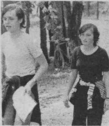
Prva je na cilj na Urhu prihitela ekipa pionirjev osnovne šole Tone Tomšič.

Tekmovanje je potekalo skupaj s pohodom od osnovne šole Toneta Tomšiča pa prek Orel do Urha. Znanje in spretnosti udeležencev pohoda so na posameznih točkah