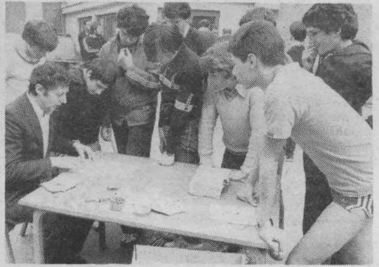
Posvet pred začetkom