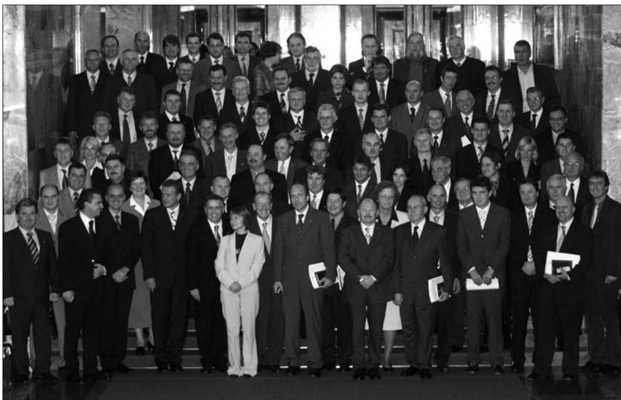
Poslanci državnega zbora na prvi seji četrtega mandata, v katerem so bile kvote sprejete v zakonodajo.

enakost spolov, ki je zelo počasno, in je na primer na Švedskem, Danskem in Norveškem trajalo 70 let preden so ženske v politiki dosegle 30 % zastopnost. 36 Spolne kvote spadajo pod radikalnejše reforme, vendar na splošno učinkujejo. Podzastopnost ženskega spola v politiki je nemogoče razumeti brez spoznanja, da se ženske v manjši meri angažirajo večinoma prav zaradi pomanjkanja časa in energije, ki ju od njih zahteva zasebna sfera življenja. Prav stereotipno se pri ženskah razpravlja o tem, kako bodo usklajevale družinsko življenje s kariero, medtem ko bi naj moškim predstavljalo urejeno družinsko življenje prednost v politični karieri. 37