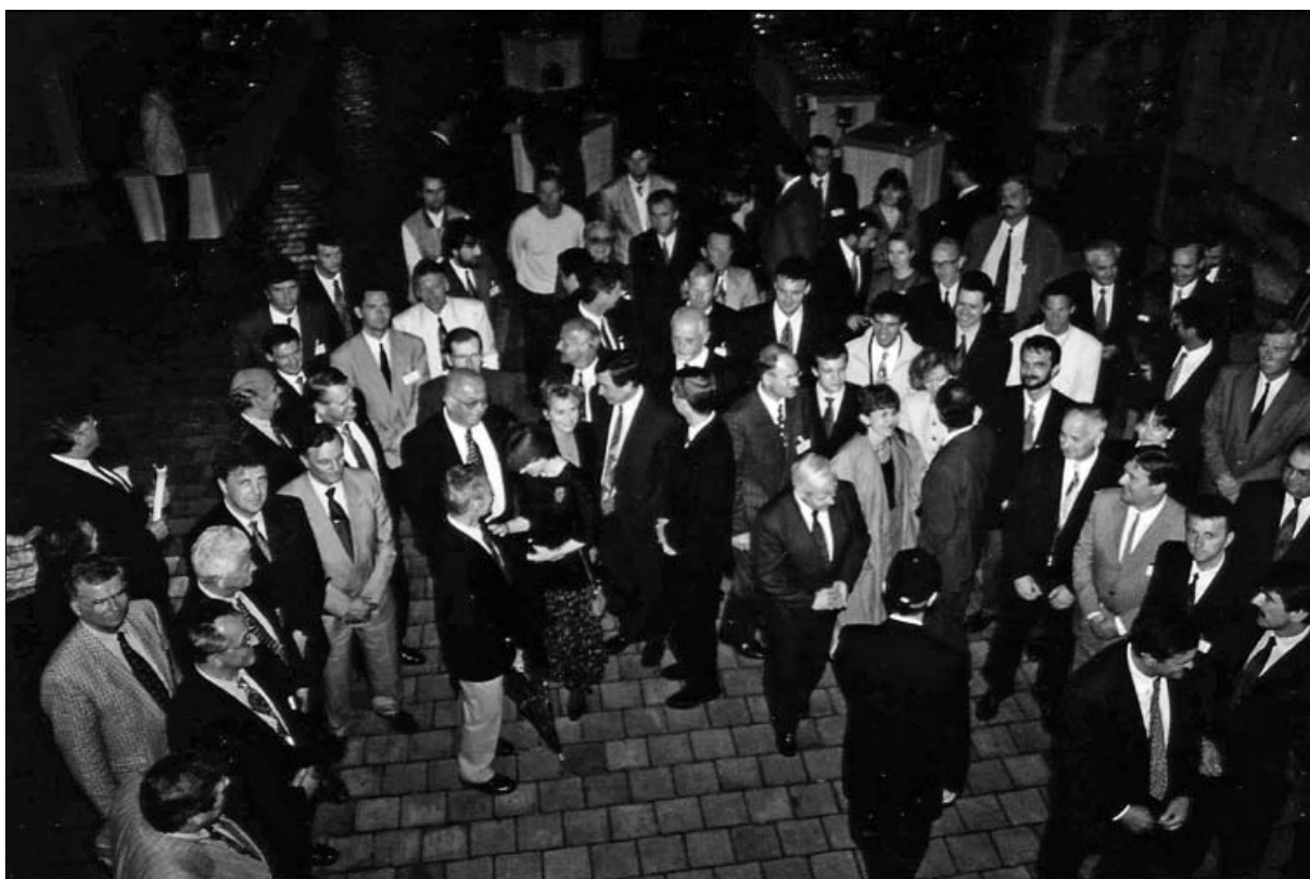
Poslanci državnega zbora ob koncu prvega mandata, v katerem se je prvič razpravljalo o kvotah. Avtorica N. Pirc, julij 1996 (Arhiv časopisne hiše Večer)