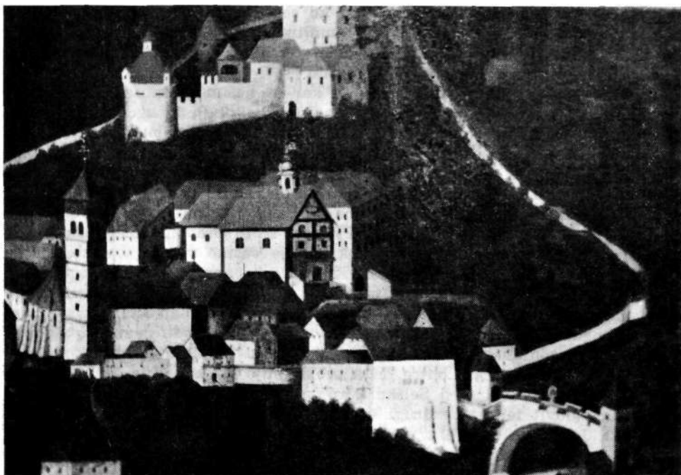
Detalj z votivne slike iz Sopotnice: Loški grad, nunski samostan, Jakobova cerkev in kamniti most čez Selško Soro. (Po originalu v Loškem muzeju v Škofji Loki.)

cerkvi, kot nekakšni subdominanti mestnega telesa, na ožje področje, tj. na severni in severovzhodni predel mesta.