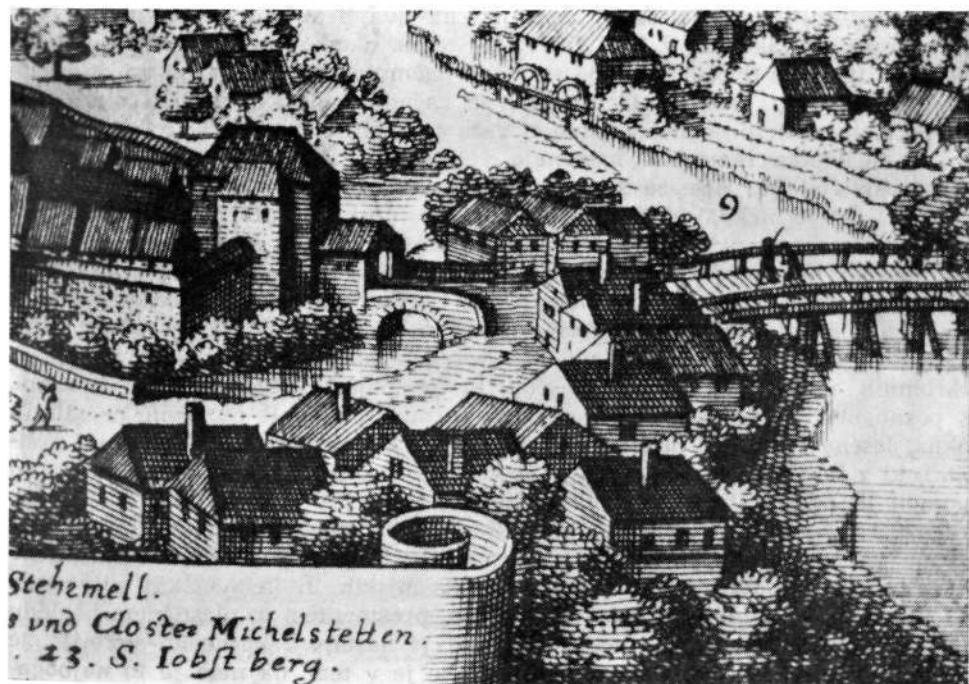
Po Merianovi upodobitvi Škofje Loke iz leta 1649: Hiše na mestnem obrobju ob Grabnu s Spodnjimi vrati in Poljansko Soro s puštalskim mostom.

Na enakomerne delce razdeljenem zemljišču, ki je obrobljalo tržni prostor in vpadno cesto, so si novi kolonisti — obrtniki in trgovci, ki jih je v zavetju gradu naselil freisinški fevdalec — postavili svoja domovanja in uredili vrtove. Nobenega dvoma ni, da so bile prvotne stanovanjske hiše v mestu lesene, s čeli obrnjene proti cesti in krite z dvokapno streho. 10 Take stavbe so se še dolgo ohranjemale na mestnem obrobju in so npr. še dobro vidne na Merianovi upodobitvi Škofje Loke. 11 Videz teh hiš močno spominja na preproste stanovanjske stavbe iz časov kmečke kolonizacije, ki so se nam, čeprav v zidani obliki, ohranile v nekaterih obcestnih vaseh tako na loškem ozemlju (npr. Stara Loka) kot tudi drugod (Predtrg pri Radovljici, Tupaliče pri Predvdoru itd.). Odlikuje jih, tako kot zgodnjo meščansko stanovanjsko arhitekturo, stroga uporabnost pri oblikovanju zunanjsčine in notranjsčine, a tudi pomanjkanje skoraj vsakršnih dekorativnih elementov. Na zunaj kažeta oba našeta tipa stanovanjskih stavb, ki sta se pojavila v Evropi v času kmečkih in kasneje meščanskih kolonizacijskih gibanj in sta zrasla ob upoštevanju antične tradicije iz različnih prvin, ki jih zasledimo v razvoju stanovanjske arhitekture v evropskem prostoru, 12 nekatere zanimive razlike. Druagačni življenjski pogoji in različne oblike gospodarjenja na deželi in v mestu so bile vzrok, da se je kmečka kolonizacijska hiša vsaj v najzgodnejši fazi