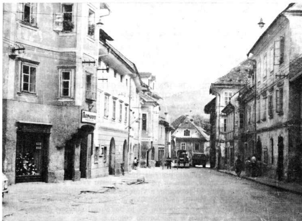
Lijakasti zaključek škofjeloškega Mestnega trga proti nekdanjim Poljanskim vratom

škofjeloški tržni prostor ne spominja več na razširjeno cesto, kakršno srečujemo največkrat pri starejših mestnih in tržnih zasnovah in kakršne so se v vzhodnoalpskem prostoru oblikovale pred letom 1200 (npr. Beljak). 1 Tlorisna oblika škofjeloškega tržnega prostora je v osnovi pravokotnik, čeprav je njegova »pravilnost« tako kot pri drugih naših srednjeveških mestih bolj ali manj odvisna od predpogojev tj. oblikovitosti tal. Kot smo že omenili, se trg v smeri proti jugozahodu lijakasto oži, dokler v bližini nekdanjih poljanskih vrat ne doseže običajne širine ceste. Po času nastanka so te lijakasto oblikovane vpadne ceste, ki so značilne tudi za nekatera druga mesta v našem in koroškem prostoru (Breže, Maribor, Radovljica, Mestni trg v Ljubljani itd.), sočasne z glavnim, pravokotno oblikovanim tržnim prostorom. O tem nas prepričujeta tudi značaj in oblika stavbnih zemljišč, ki se prav nič ne razlikujeta od parcel, ki so razporejene okrog tržnega pravokotnika, 2 po drugi strani pa vloga, ki so jo lijakaste vpadnice imele pri fortifikaciji mesta, še posebej pri postavitvi mestnih vrat, ki so predstavljala njihov organski zaključek. Skoraj ne dvomimo, da je današnji kompleks zgornjega glavnega trga nastal sredi 13. stoletja, ko se Šofja Loka leta 1248 prvič omenja kot trg (forum). Ni pa izključeno, da se to ne bi moglo zgoditi že prej, saj se te oblike trgov pojavljajo že vso prvo polovico 13. stoletja (Maribor, Ljubljana — Mestni trg itd.).