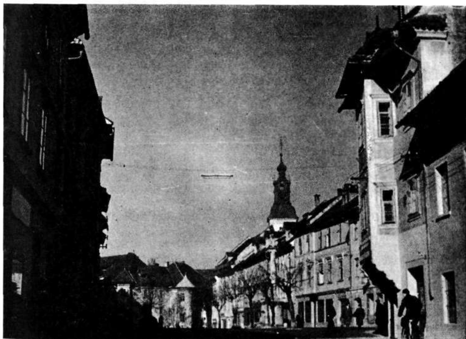
Mestni trg v Škofji Loki s Homanovo hišo v ozadju in zvonikom Jakobove cerkve na desni

Oblikovanju talnega načrta naselbine v 1. polovici oziroma sredi 13. stoletja sledi z ustanovitvijo mesta (prva omemba 1274) izgradnja obrambnih naprav (prva omemba leta 1314). 4 Fortifikacija doseže svoj vrh v prizadevanjih škofa Konrada III. (1314—1322), ko naj bi po predvidevanjih P. Blaznika 5 obrambne naprave oklenile tudi novo nastali Lontrg, čigar ime (Novi trg — »in dem neuen marck«) se začenja pojavljati v virih od konca 14. stoletja dalje. 6 Zunanji videz stolpov na področju Lontrga, ki so se nam ohranili na votivnih in drugih slikah iz 17. stoletja 7 in imajo zgodnejšo pravokotno tlo-risno zasnovo, sicer ne nasprotuje tej domnevi, vendar se zdi, da je bil utrdit-