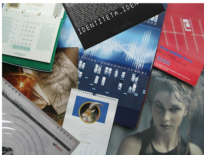
Koledarji, prispeli na razpis.

Ostrina in kakovost slik sta zelo dobri, enako velja za barvno