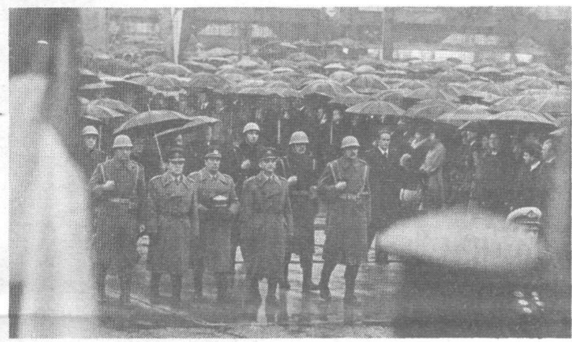
Nema, brezštevila množica, zadnje izkazane časti