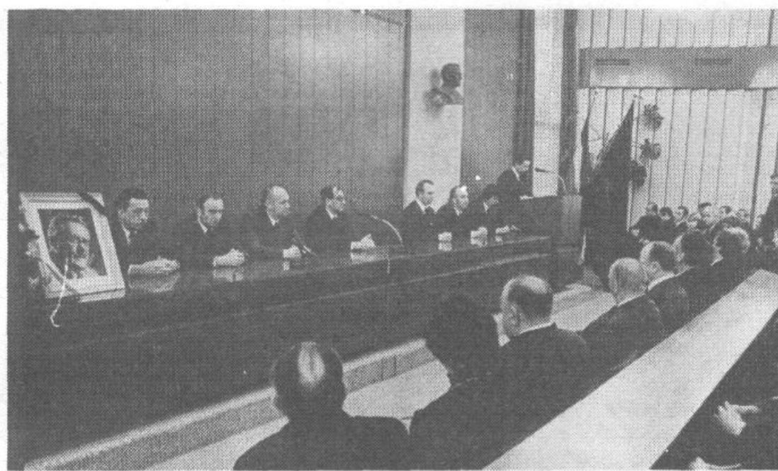
»Ločiti smo se morali od njega. Trpko je bilo to dejstvo, ko je misel nanesa nanj.« Z osrednje komemoracije, ki je bila v nedeljo 11. februarja v veliki dvorani občinske skupščine