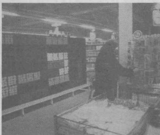
Značilnost Emona centrov je tudi velika izbira volne