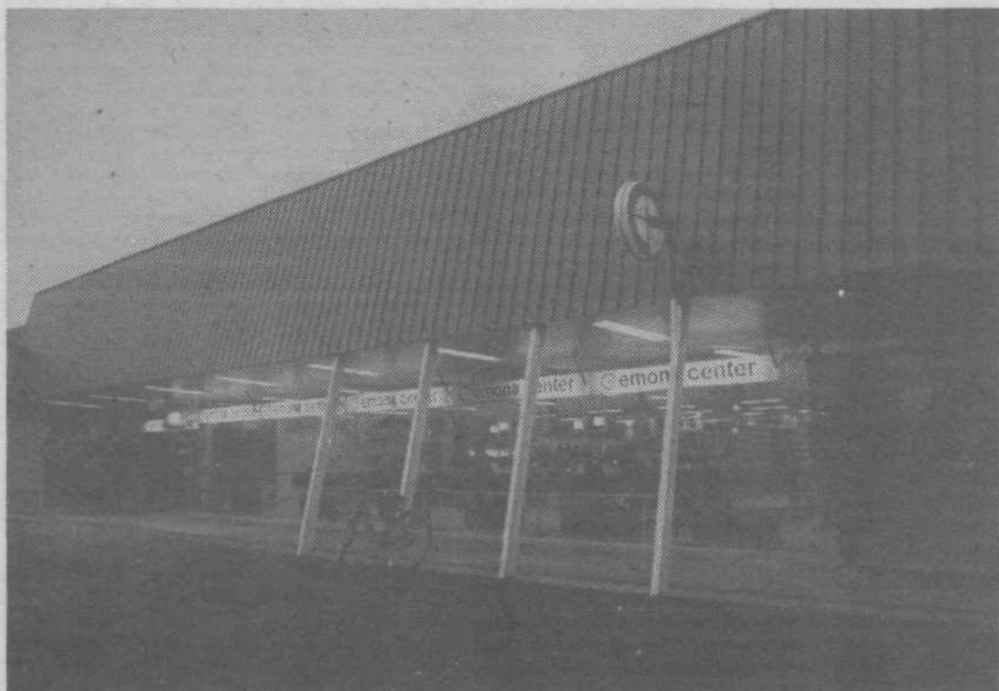
Emona center z vzhodne strani; telefonske govorilnice omogočajo krajanom boljšo povezavo z drugimi kraji