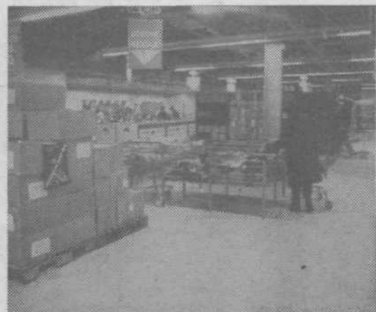
Prodajajo tudi pakete rezervne hrane tovarne Kolinska