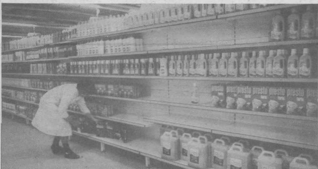
Tudi v Emona centru so police, kjer naj bi bili zbrani praški, prazne. Dobivajo jih sicer skoraj vsak dan, vendar jih tudi takoj prodajo

dostikrat niso vedeli, kje lahko najdejo iskano blago, pa tudi naše prodajalke se niso vedno najboljše znašle. Nekateri kupci so to razumeli, drugi pa ne. Za prihodnje pa si želimo predvsem sodelovanja s potrošniškim svetom krajevne skupnosti. Tako bi bolje spoznali želje in potrebe kupcev, saj si vsi delavci v trgovini želimo, da bi bili potrošniki zadovoljni z izbiro in postrežbo. Dostej še nismo iskali stikov s potrošniškim svetom, predvsem zato, ker imamo še toliko opraviti sami s seboj.«