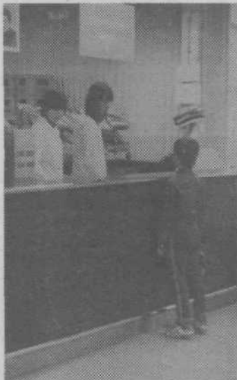
Takoj ob vходу desno je moč dobiti vse potrebne informacije ter kupiti revije, časopise, cigarete, vžigalice in druge drobnarije