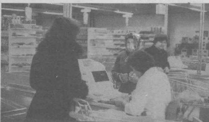
Kadar je kupcev veliko, dela vseh osem blagajn, tako da ni dolgih vrst

Z vozičkom, ki je sicer nekoliko velik za manjše nakupe, pripelje kupec blago do polic, kjer ga zavije v papir ali spravi v vrečke