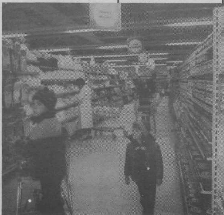
Prostornost omogoča veliko ponudbo raznih živil in blaga, pa tudi njihovo dobro izbiro. Otroka (na sliki) pa najbrž iščeta oddelek s sladkarijami ali igračami