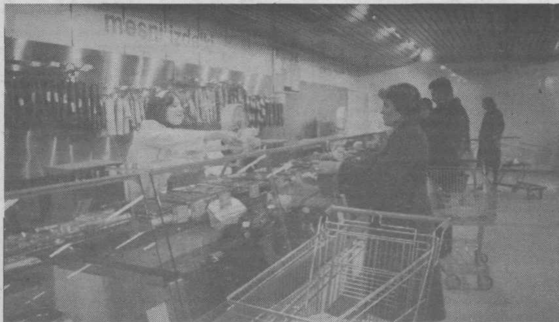
Vedno je na voljo dovolj svežega mesa, tudi telečjega in svinjskega, mesnih izdelkov in delikates