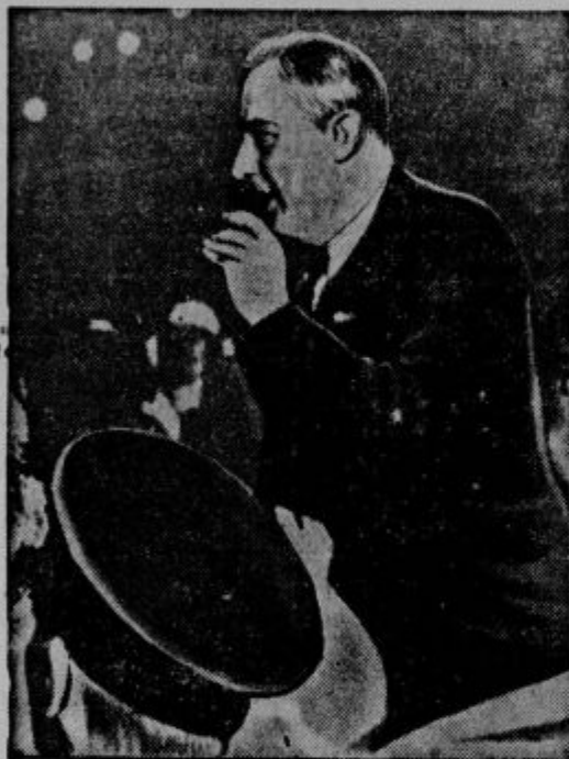
Minuta po atentatu v Miami. Roosevelt je zaklical: »Nisem zadet!« S tem je pomiril razjarjene množice.