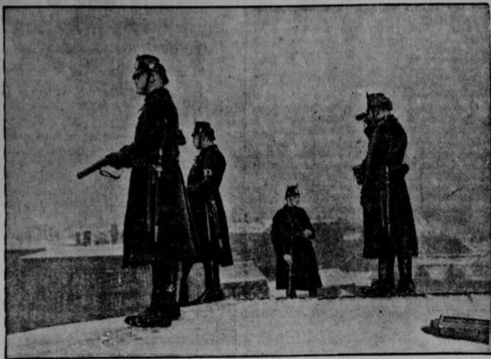
Policijska postaja na strehi. Med koncertom S. A. na Brüloweru trgu v Berlinu (kjer se dogajajo najhujše nemiri in krvava nasprotstva) opazujejo berlinski policisti s strehe, da se ne bi kaj pojavilo nered. V rokah imajo aredstva za pomirjenje.