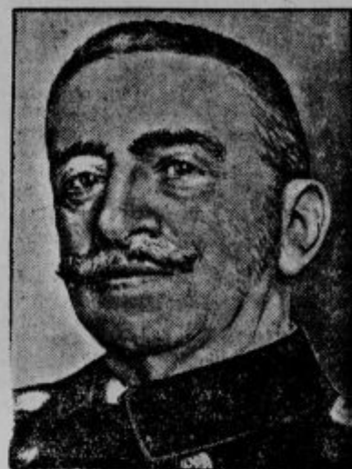
Zadnji španski ministrski predsednik iz monarhične dobe, admiral Aznar, je te dni umrl.

Neenako število dni posameznih mesecev datira še iz rimskih dob. Rimljani so odredili dolgost in imena mesecev. Imena so dajali deloma po bogovih deloma po velikih Rimljanih. Že smo omenjali, da so dali po smrti Julija Cezarja dotodanjemu Kvintiliju ime Julij. Naslednjemu mesecu so dali ime po kasnejšem cesarju Avgustu. Ker pa je imel julij 31 dni, a Avgust je trideset, se je Avgust razrdil. Zatorej so rimski astronomi kar na lepem odvzeli februarju (ki je bil takrat zadnji v letu) en dan. Da pa ne bi imel tudi september 31 dni, so odbili tudi njemu en dan in ga dali oktobru. In tako so vse spremenili do decembra.