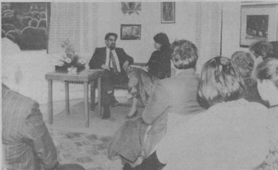
Literarni večer s Cirilom Zlobcem v grosupeljski knjižnici je bil poslušalcem na moč vseh, čeprav se je pogovor ognil politiki in se je rajši ukvarjal s poezijo in ljubeznijo.