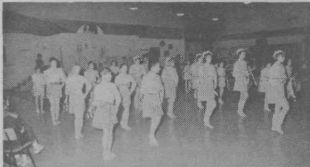
Grosupeljske mažoretke so že po tradiciji nastopile na celovečernem koncertu pihalnega orkestra v OŠ Louis Adamič.