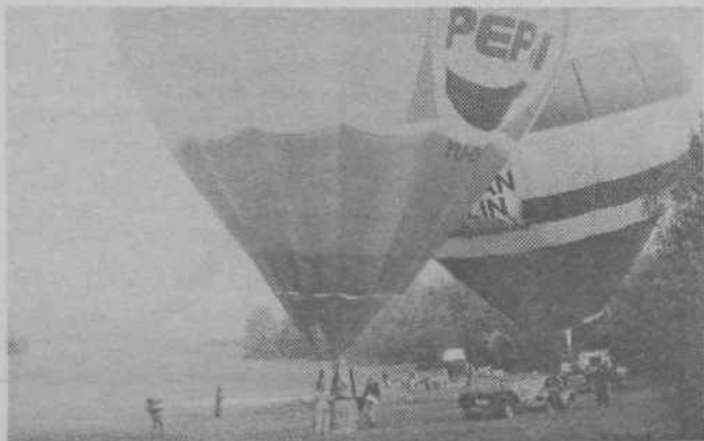
Vreme je bilo lepo, zato so imeli pri Ponovi vasi start republiškega tekmovanja slovenski balonarji, 6 najboljših ekip.