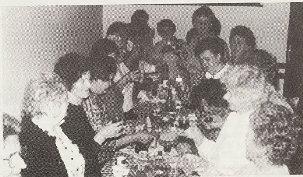
Veselo raspoloženje upokojencev Libne ob bogati mizi in prijetnem domačem vzdušju