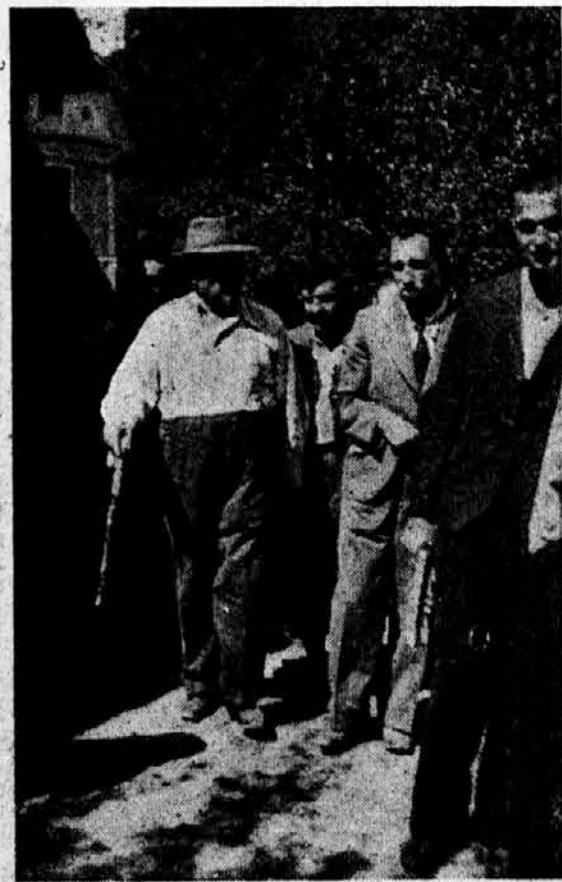
Voditelj med »svojimi fanti«