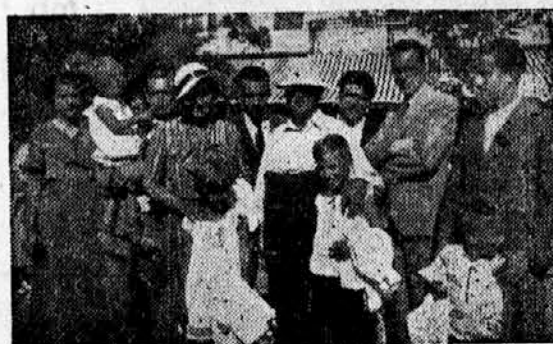
Naš voditelj v krogu znancev iz Slovenije, ki so ga obiskali na Hvaru (junija 1934)

Velika je razlika med mladino, ki je naša, in med mladino, ki ni naša. Nočemo splošno sumničiti mladine, ki ni naša, ampak radovoljno predpostavljamo, da je idealna in dobronamerna. Toda mi jo samo opozarjamo, da za njo stojijo starešine in tudi cele organizacije, katere so bodisi republikanske, bodisi destruktivne, bodisi celo komunistične. To dobro mladino v slabi družbi pozivamo, naj nam da roko v idealno patriotsko pobratimstvo, da se skupno borimo za mir človečanstva, za srečo naše domovine in za dobro našega kralja. Naj se porinejo v stran vsi, ki nas ovirajo na tej poti!