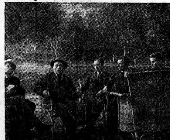
V krogu akademikov-stražarjev na tečaju v Poljčah

Kdor je dobrega mišljenja, kdor hoče varovati našo narodno dinastijo, kdor hoče ohraniti pridobitve naše narodne in krščanske civilizacije, kdor hoče socialno evolucijo, a ne revolucijo, kdor hoče svobodo, a ne tiranstva, naj gre z nami na stražo za naše ideale. Podajmo si roke in korakajmo!