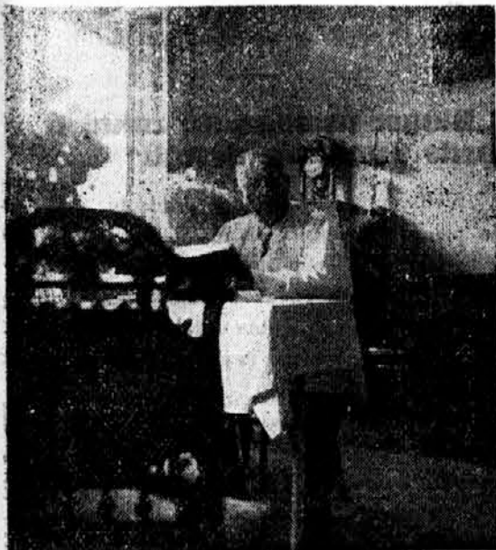
Voditelj v svoji delovni sobi v Marjanišču

Pokojni dr. Anton Korošec je bil velik politik. O tem ni treba nobenih razprav, to je soglasna ugotovitev vseh ljudi, vseh struj in vseh taborov. Da, bil je tako velik politik, da mu ni bilo mogoče ugovarjati, tudi če bi storil kaj napačnega.