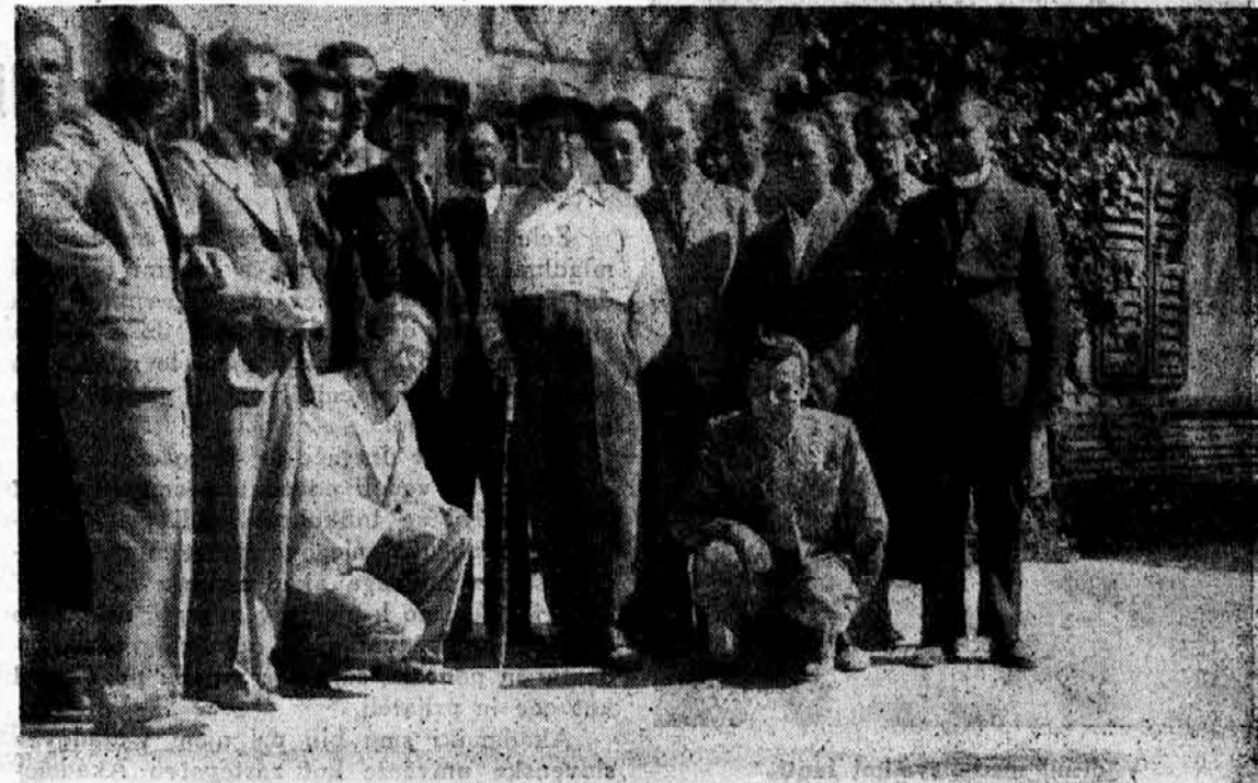
Po zaključenem tečaju v Begunjah

Šesti januar nas je iznenadil v razmerah, ko med akademsko mladino in našim narodnim voditeljem ni bilo pravičnega razmerja.