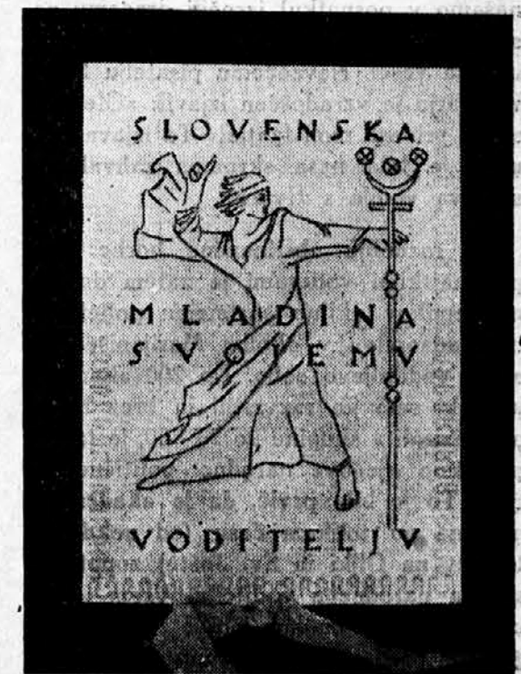
Vdanostna izjava s podpisi 400 slovenskih akademikov iz l. 1935

Ta Koroščevo vodila v Hvara smo vzeli s seboj v Slovenijo in jih kakor olimpijsko baklo zanesli na Zabreško planino, kjer so nas čakali naši tovariši. Na Zabreški planini je tedaj padel sklep, da bo v jeseni 1934 pričela izhajati »Straža v viharju«. Koroščevo vodila s Hvara so postala neobjavljena listina stražarskega udejstvovanja.