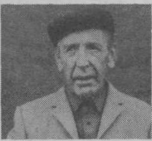
nosov v krajevni skupnosti; bil si njen prvi predsednik, od vsega začetka pa si bil predsednik borbevske organizacije — vse dotlej, dokler te ni strla bolezen.

Mnogo prezgodaj te je neizprosnna smrt iztrgala iz naše sredine. Tvoje delo se ni nikdar ustavilo, bil si neumoren politični, gospodarski delavec in aktivist. Že leta 1941 si spoznal le eno pot: pot organiziranega in oboroženega odpora proti okupatorju. Že spomladi leta 1941 si bil med ustanovitelji vaškega odbora OF. Tvoja pripadnost ni ostala skrita okupatorju. Bil si interniran v italijanska in pozneje v nemška taborišča. Vse to te ni zlomilo, kljub grozotam, ki si jih prestal. Takoj po osvoboditvi so ti bile zaupane odgovorne dolžnosti poveljnika narodne zaščite, prvega tajnika NOO, prvega predsednika KLO, sekretarja partije. Vse dolžnosti si opravljal uspešno in vselej visoko cenil sodelovanje vseh vaščanov. Tvojih uspehov in prizadevanj je nič koliko: pričetek in gradnja zadružnega doma, asfaltiranje vaških cest in poti, gradnja novega gasilskega doma — za kar te je Gasilsko društvo proglasilo za častnega člana — in še bi lahko naštevali. Ogromen je bil tudi tvoj delež pri gradnji ljudske oblasti in socialističnih samoupravnih od-