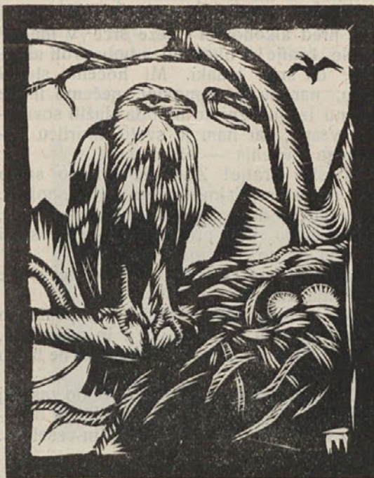
Orel na gnezd.

le narahlo šuštenje listja je motilo skrivnostno tišino. Globoko v nižavi šepeta vrelec, v vejevju pa pričinja gozdni pevec svojo zategnjeno, še na pol zaspano jutranjo melodijo. Sicer pa vse tiho — povsod tisti čarobni mir, ki se ga nekako bojiš, pa ti vendar tako lujaja.