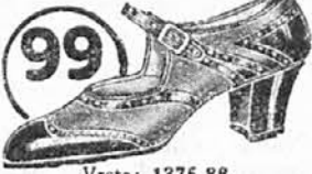
Vrsta: 1375-88 Lahek in eleganten kombiniran čevljevček