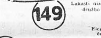
Vrsta: 1837-21 Lakasti nizki čevlji za družbo in ples