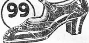
Vrsta: 2645-14 Eleganten, močan in poceni, iz telečjega boksa