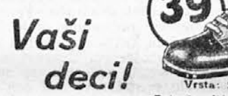
Vrsta: 5860-00 Tale čevljevček smo izdejali za najmlajše v rjavi, črni, in kombiniranih barvah

Vsem damam in gospodičnam, ki rade nosijo čevlje z nizko peto, priporočamo tale dober in ceneni čevljevček