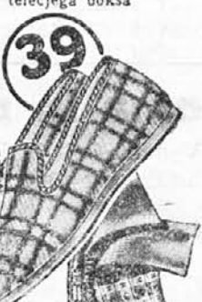
Vrsta: 7217-20 V teh si otpočijete noge