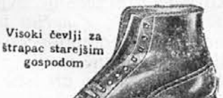
Vrsta: 1977-22 Visoki čevlji za štrpac starejšim gospodom