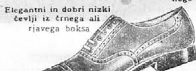
Vrsta: 1933-22 Elegantni in dobri nizki čevlji iz črnega ali rjavega boksa