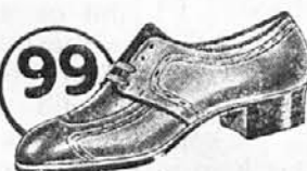
Vrsta: 4625-55 Za sport