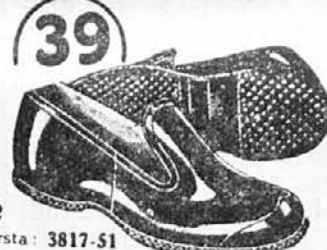
Vrsta: 3817-51 Kdor nosi glavoše Bata, ne boji se dežja ne blata