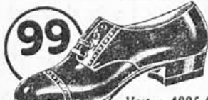
Vrsta: 4825-85 Starejše dame nosijo rade lakaste polčevlje