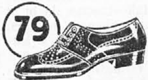
Vrsta: 4824-60 Perforiran čevljevček iz laka, ki vsaki deklici lepo pristaja