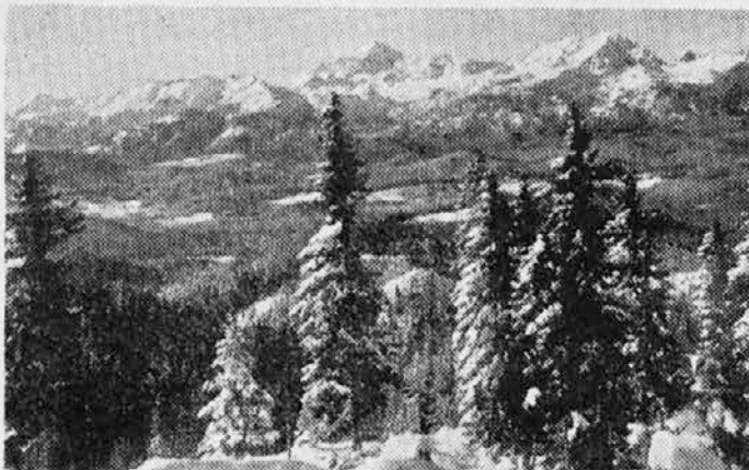
POKLJUKA: Pogled na zasnežene vrhove Julijskih Alp

V Njujorku sta dva zidarja delala na strehi donebnika z 21 nadstropji, ko se je nenadoma utrgala vrv, na katero sta bila privezana. Strmoglavila sta v globino, toda eden je imel srečo, da se je ujel za nadzidek v 17. nadstropju, tako da se mu ni nič zgodilo. Tovariš je letel globlje, a tudi on je v 3. nadstropju udaril na neko vrv in se rešil. Strah ga je pa tako pretresel, da so ga morali odpeljati v bolnišnico.