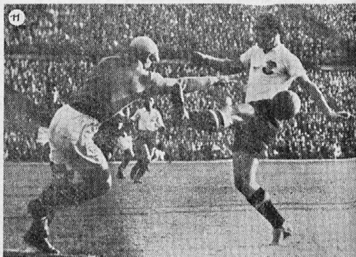
PRIZOR S TEKME AVSTRIJA — FRANCIJA