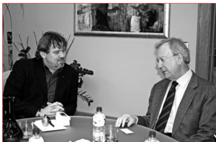
Obisk veleposlanika iz Avstrije pri županu.

V povorki 50 skupin veselih maskar iz vrtcev je sodelovala tudi