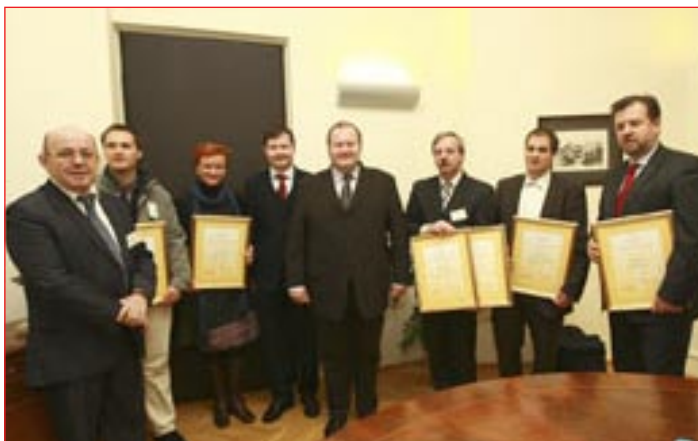
Pošta Slovenije je ptujsko bolnišnico razveselila z donacijo v višini 6.500 evrov.

Univerzitetni klinični center Maribor je s strani Pošte Slovenije prejel donacijo v skupni višini 19.500 evrov, Splošna bolnišnica dr. Jožeta Potrča Ptuj, Center za socialno delo Maribor ter Nadškofijska Karitas Maribor pa donacije v zneskih po 6.500 evrov. Pošta Slovenije je tako v humanitarne namene razdelila kar 39.000 evrov. Pošta Slovenije sicer kot sponzor in donator sodeluje pri različnih aktivnostih na športnem, izobraževalnem, znanstvenem, kulturnem in umetniškem področju, aktivno pa se vključuje tudi v izvedbo humanitarnih akcij.