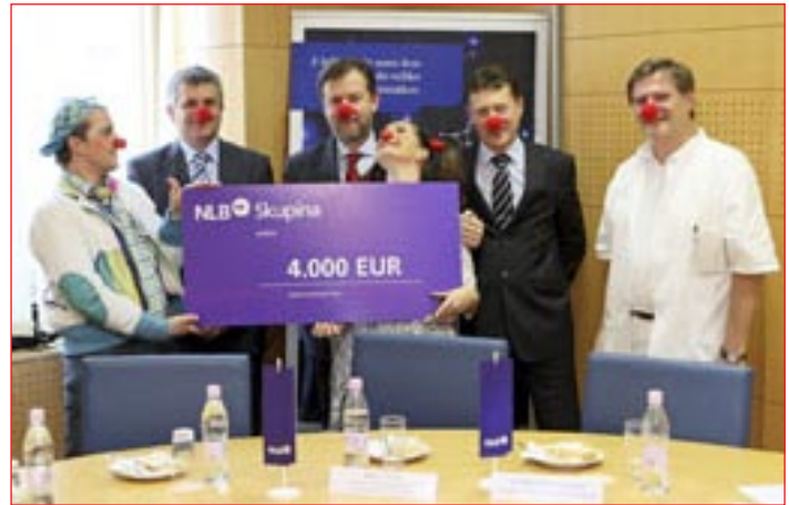
Tako veselo je bilo ob predaji donacije NLB otroškemu oddelku ptujske bolnišnice.

»Še vedno je veliko podjetij, pri katerih ni beseda humanitarnost zgolj beseda, ampak gre res za dejanja. Če samo povem, kakšen je bil odziv podjetij, ko smo jim sporočili, da z naše strani ne bo novoletnih daril, ne čestitk, so se sami praktično počutili kot