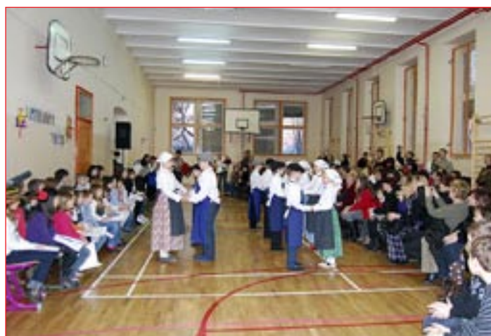
Nstopila je šolska folklorna skupine, ki so jo sestavljali učenci petih razredov.