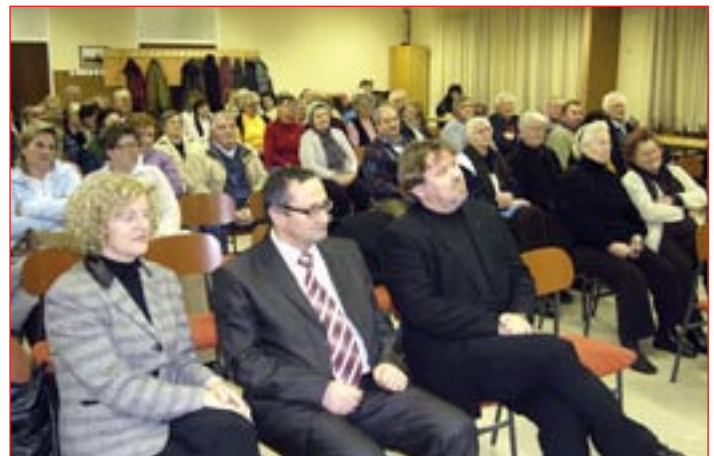
S predstavitve projekta »Zdravo življenje« v ČS Jezero v Domu krajanov Budina - Brstje

Prvo merjenje krvnega tlaka, holesterola, trigliceridov in krvnega sladkorja je bilo izjemoma že 30. januarja, udeležilo se ga je 31 krajanov. Z odzivi so v ČS Jezero zelo zadovoljni, saj se je tudi drugega sklopa projekta oziroma dveh predavanj z nasveti