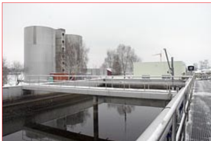
Čistilna naprava na Ptuj.

S tovarno proteinskih koncentratov – projekt je bil zaključen v letu 2009 – so zmanjšali količino odpadkov, ki nastanejo kot stranski proizvod. Rekonstrukcija obstoječe čistilne naprave