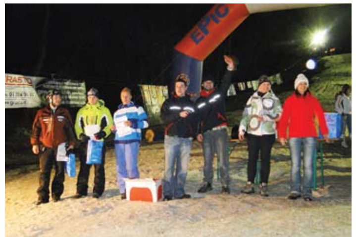
Podelitev nagrad najboljšim