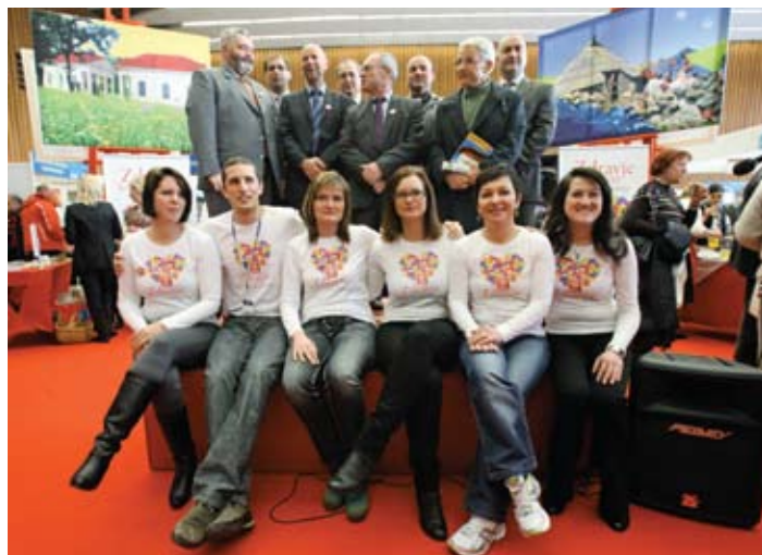
Ekipa Centra za razvoj Litija s predstavniki občin Srca Slovenije