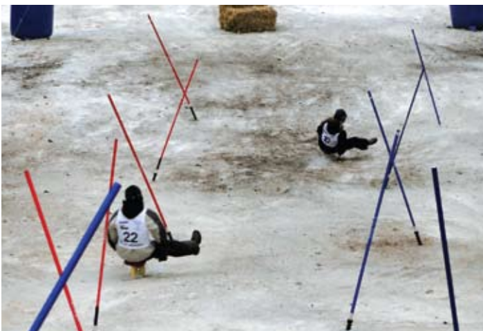
Razburljiv spust v zeleno dolino