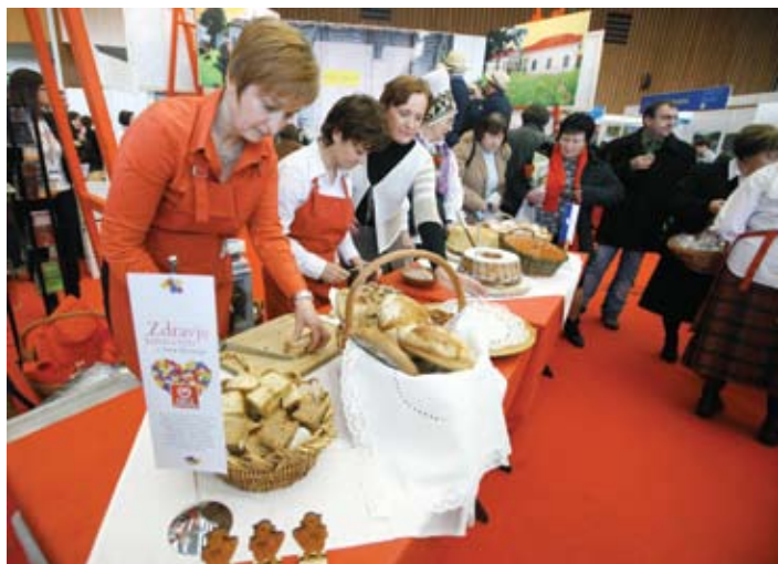
Pod znamko Srce Slovenije se je na turističnem sejmu Alpe-Adria zvrstilo preko 300 nastopajočih iz devetih občin