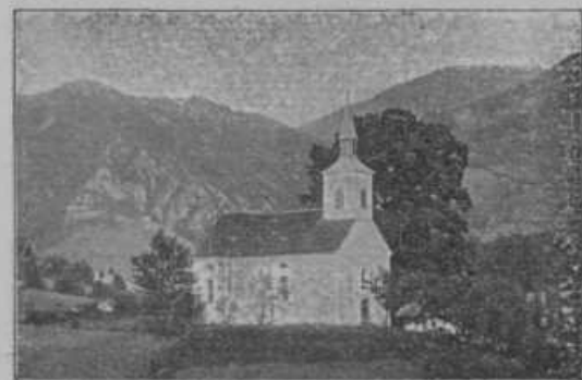
Cerkev sv. Rozalije v Kostrivnici blizu Šmarja, ki jo je Slomšek zadnjo posvetil. Od tu je že bolan odšel v Maribor.

malo je delavcev, ki bi na tem polju delali...« Kmalu je bilo bolje. Bog je poslal gorečemu delavcu vnetih sodelavcev na polju katoliškega tiska. Knjige za mladino in ljudstvo so se množile. Krona med njimi je bila »Blaže in Nežica«.