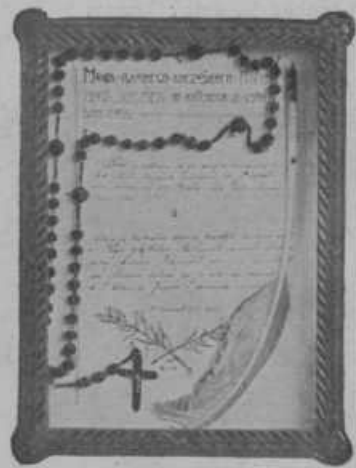
Pero, s katerim je Slomšek podpisal listino o posvetitvi cerkve sv. Križa pri Belih vodah in njegov rožni venec, na katerega je vsak dan molil.

Nič manj ko mladina je bilo Slomšku pri srcu slovensko ljudstvo. »Veliko je polje... malo imamo dobrih knjig...«