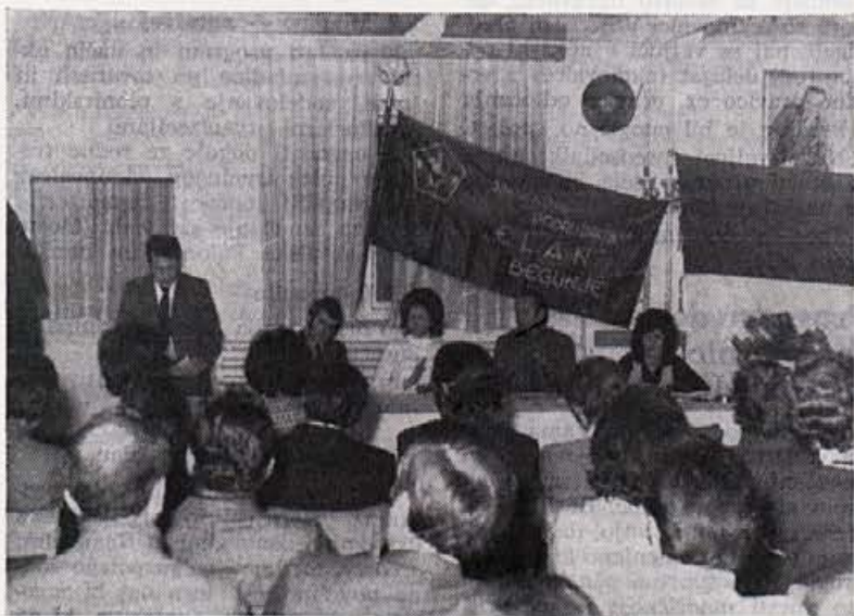
Med predsednikovim poročilom