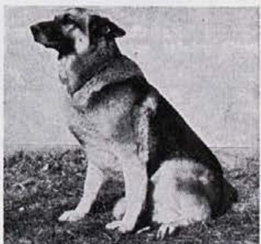
Zvesti tovarniški varuh se je že izkazal v nekaj primerih