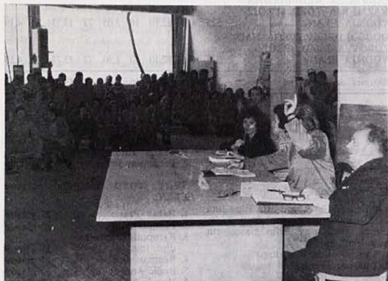
Zbor delavcev sprejema samoupravne akte