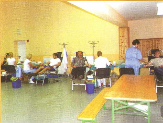
Krvodajalska akcija – Véradás