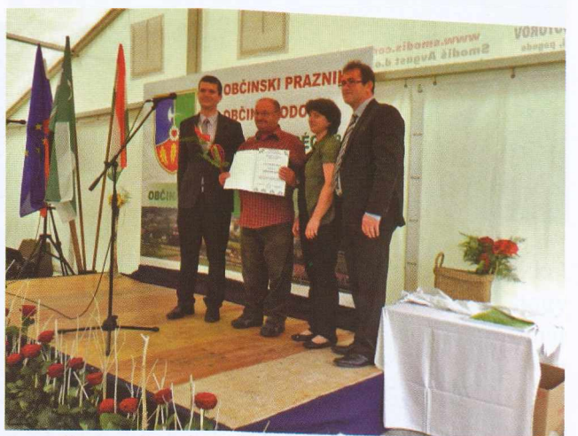
Za požrtvovalno delo-Az odaadó munkáért