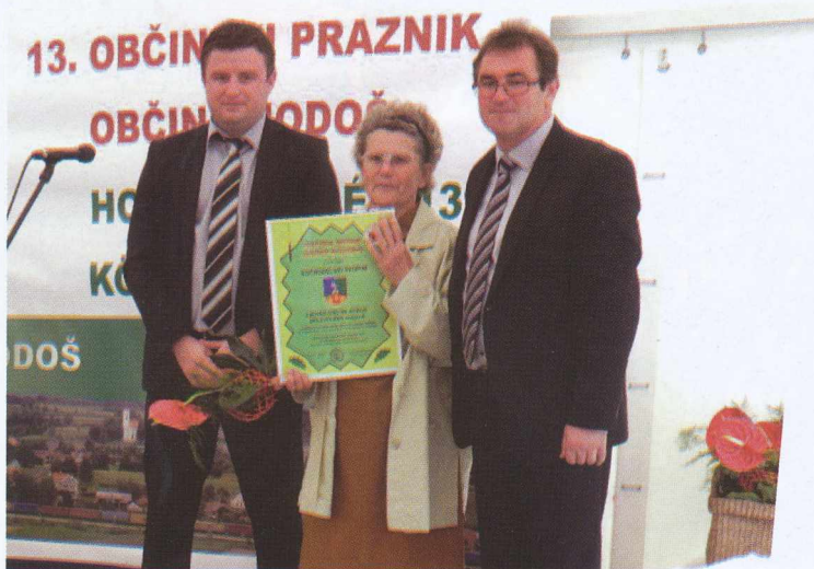
Ročnodelska skupina - Hímzőszakkör