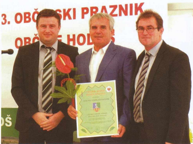
Dom starejših Hodoš-Hodos idősek otthona