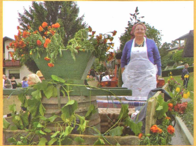
Trgatvena povorka – Szüreti felvonulás