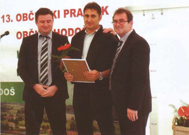
Občinski komunalni in javni delavci Községi komunális és közhasznó munkásai