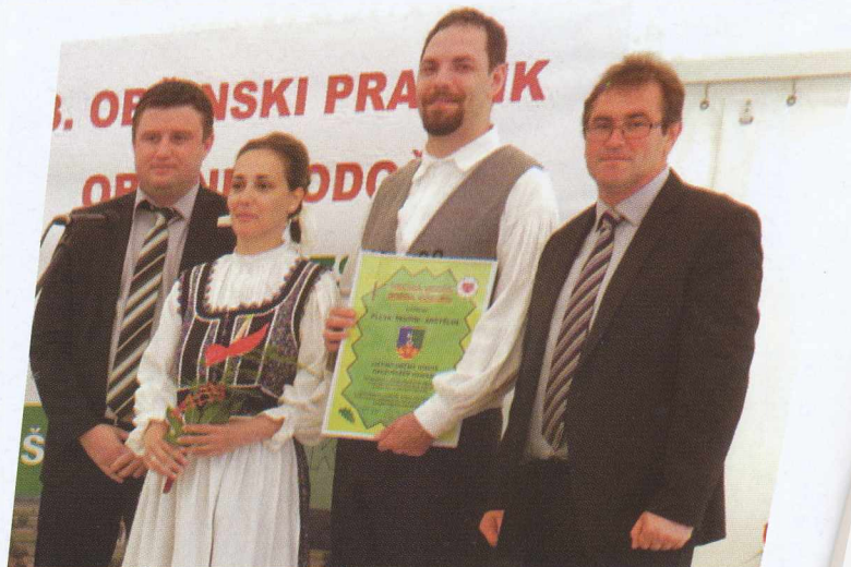
Plesna skupina Árgyéus-Árgyéus táncsoport

Izdaja občina Hodoš – Hodos község jelenteti meg