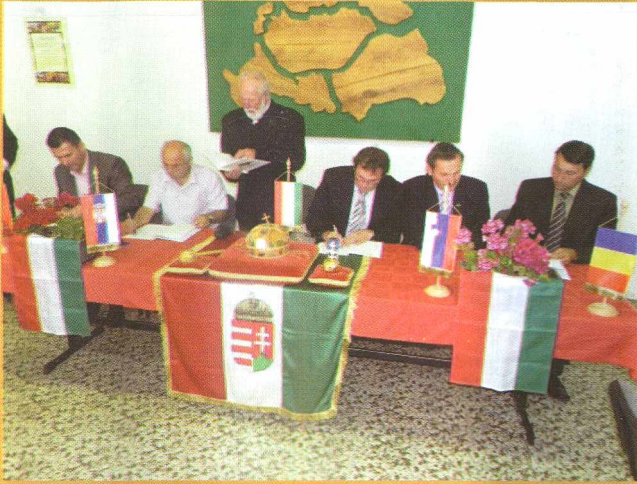
Medsebojno sodelovanje – Együttműködési megállapodás