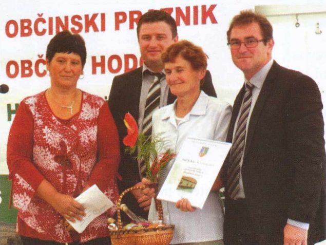
Najlepše rože-Legszebb virágok