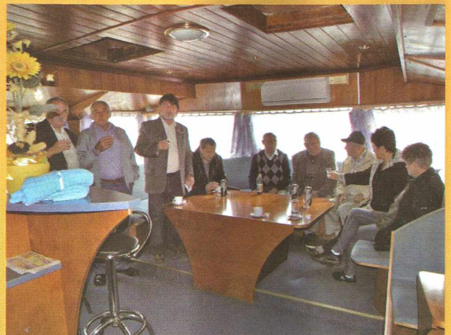
Izlet upokojevcev – Nyugdíjas kirándulás