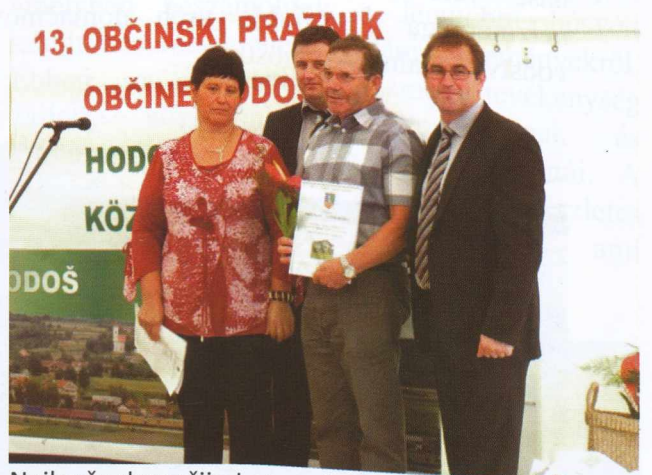
Najlepša domačija-Legrendezettebb otthon