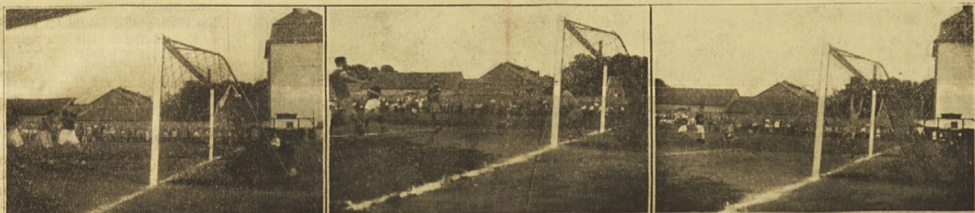
Momenti iz tekme Concordia : Ilirija

Krasna igra Concordie, ki zmaga zaslužno — Črn dan Ilirije — Najboljši mož na polju Premerl — Dva auto-gola