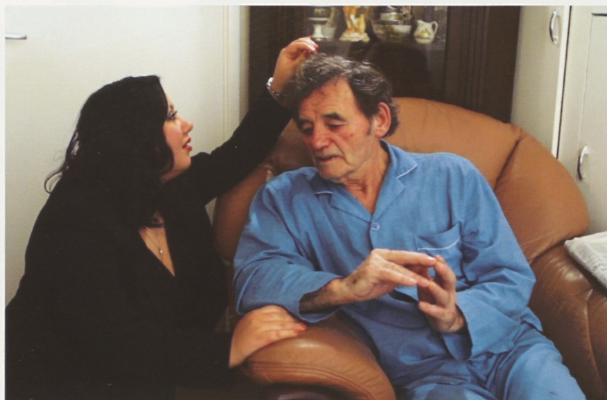
Harold postaja zombi

Balaguerójevega najnovejšega filma, v Ljutomeru nagrajenega Medtem ko si spala (Mientras duermes, 2011), je postavljeno v starinsko barcelonsko stolpnico, tu pa se podobnost z epidemijo zombijev v Snemaj! tudi konča. Njegova pošast je tokrat precej bolj zahrbtna: skriva se v podobi tihega, plahega Césarja, ki ga večina stanovalcev stare in elegantne stolpnice, kjer dela kot vratar in hišnik, niti opazi ne. Zato pa on opazi njih. Psihopat, ki se mu fizično nasilje pravzaprav upira, ne more mirovati, dokler je v njegovi bližini kdo, ki ni popolnoma nesrečen ... 1