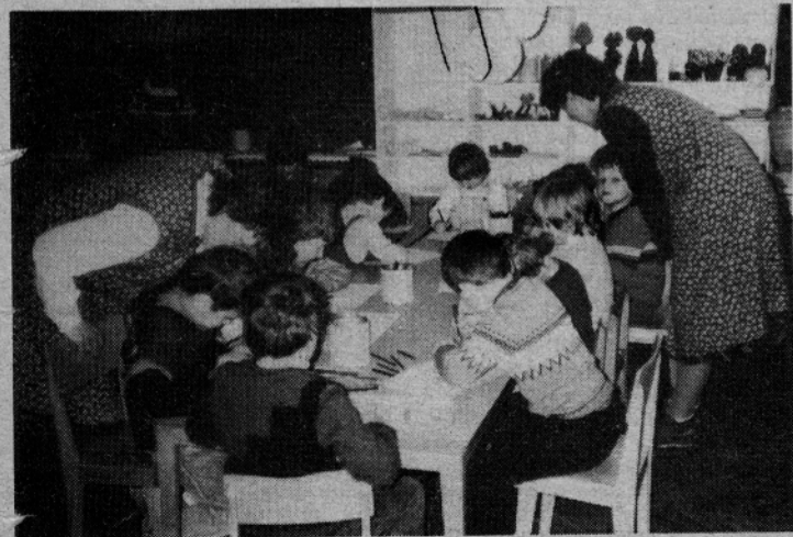
Med predšolskimi otroki v vrtcu Gornji grad

Prijavijo se lahko kandidati, ki izpolnjujejo splošne pogoje in so opravili poklicno šolo ustrezne smeri in tudi kandidati brez končane gostinske šole, vendar z delovnimi izkušnjami in uspešno delovno zmožnostjo za gostinska dela. Poskusno delo za vsa dela in naloge traja dva meseca. Prijave z dokazili o izpolnjevanju pogojev zbira kadrovska služba zadruga do 3. marca 1987. O izbiri bodo kandidati obveščeni v roku 10 dni po poteku roka za prijavo.