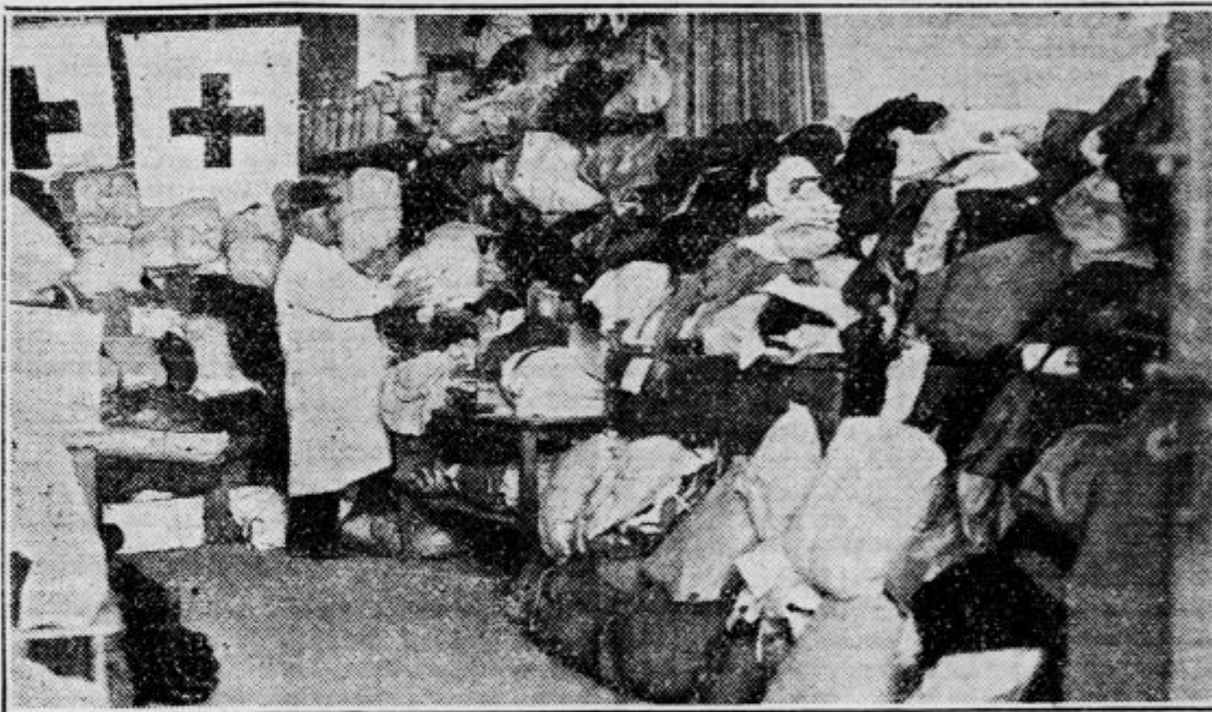
Vrli upravnik Jagodic izbira, sortira, desinficira, notira in krizo prezira...

Pogled v skladišče sredi Ljubljanskega polja